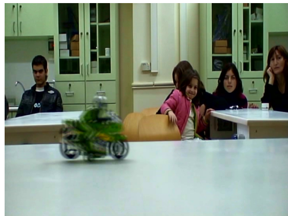
Εικόνα 19 – Πειραματισμοί μαθητών με κάμερα σε εκπαιδευτικό σεμινάριο