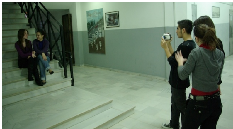
Εικόνα 15 - Γυρίσματα ταινίας μικρού μήκους στα πλαίσια σεμιναρίου