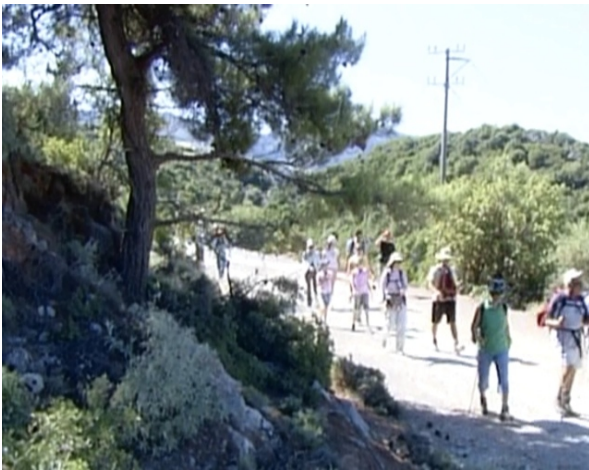
Εικόνα 22 – Αθλητικές δραστηριότητες