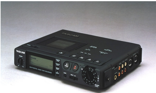
Εικόνα 3 - Tascam DA-P1 DAT Recorder