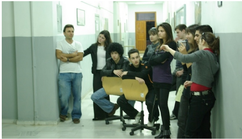
Εικόνα 16 - Γυρίσματα ταινίας μικρού μήκους στα πλαίσια σεμιναρίου