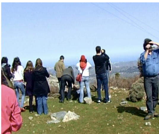
Εικόνα 24 – Φωτογράφιση και βιντεοσκόπηση φυσικού τοπίου