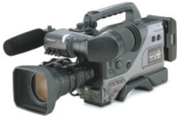
Εικόνα 6 - Camera Panasonic DVC200