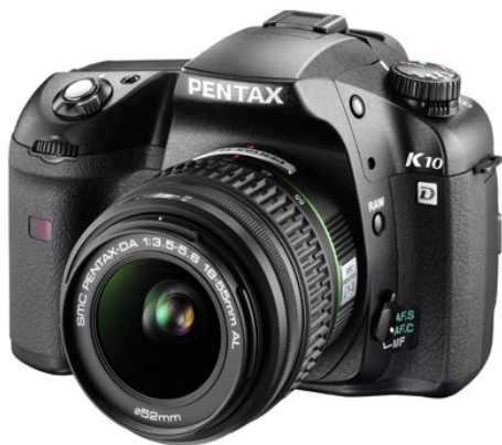
Εικόνα 7 - Φωτογραφική μηχανή Pentax K10D