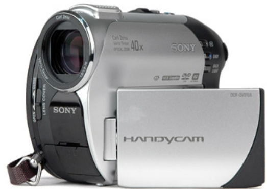
Εικόνα 2 - Camera Sony DCR-DVD108