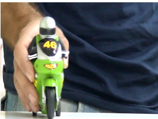
Εικόνα 18 – Πειραματισμοί μαθητών με κάμερα σε εκπαιδευτικό σεμινάριο