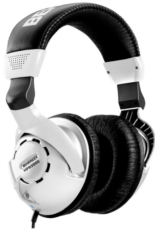
Εικόνα 5 - Ακουστικά Behringer HPS3000