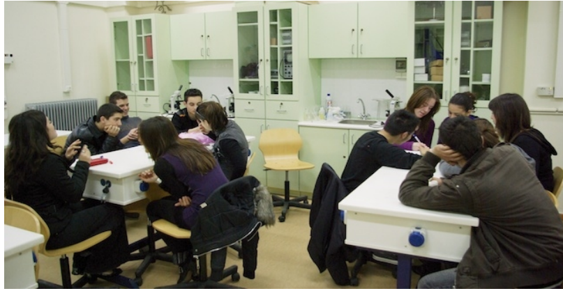
Εικόνα 13 - Μαθητικές εργασίες σε εκπαιδευτικό σεμινάριο