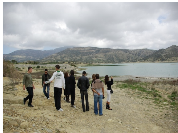
Εικόνα 25 – Φωτογράφιση και βιντεοσκόπηση φυσικού τοπίου