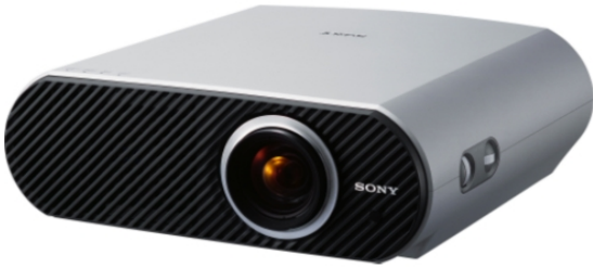
Εικόνα 1- Projector Sony Cineza HS51A