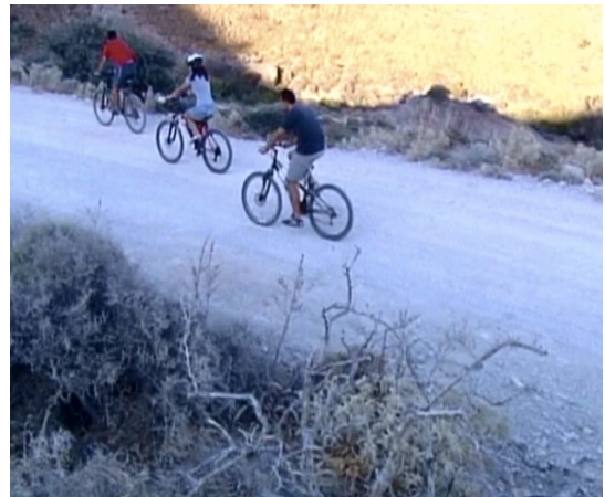
Εικόνα 23 – Αθλητικές δραστηριότητες