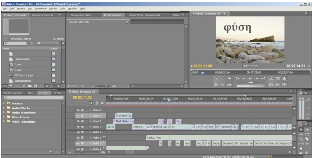
Εικόνα 12 – Οθόνη Adobe Premier Pro με το ολοκληρωμένο project