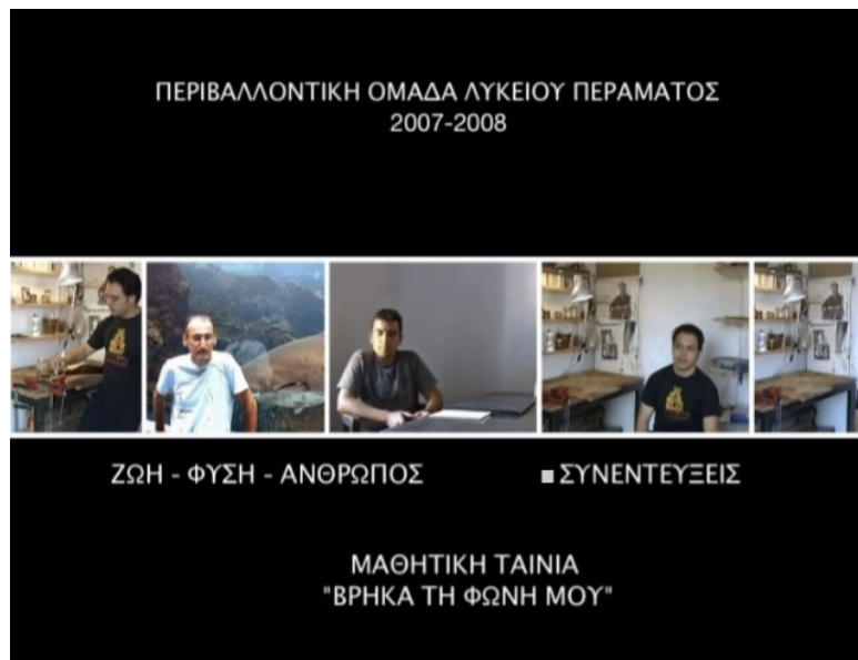
Εικόνα 11 - Οθόνη επιλογών (Menu) του DVD