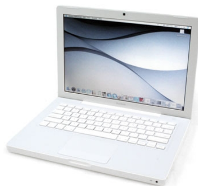
Εικόνα 10 – Υπολογιστής Apple Macbook