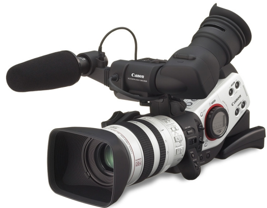
Εικόνα 8 – Camera Canon XL2