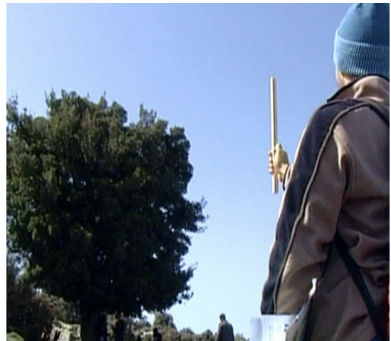
Εικόνα 21 – Μαθητικές δραστηριότητες