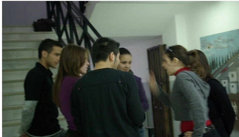
Εικόνα 14 – Οργάνωση γυρισμάτων ταινίας μικρού μήκους στα πλαίσια σεμιναρίου