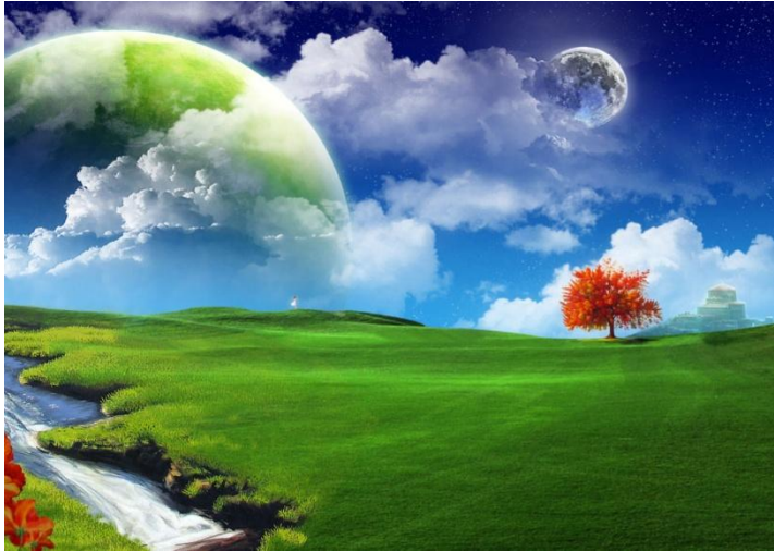
Εικόνα 4: πράσινη επιχειρηματικότητα

Στηρίζεται ουσιαστικά σε δύο βασικές ανάγκες της σύγχρονης κοινωνίας και των πολιτών της. Στην ποιότητα ζωής και φυσικά στην αναγκαιότητα της διατήρησης και της ήπιας αξιοποίησης του φυσικού περιβάλλοντος.