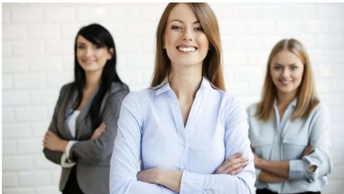
Εικόνα 2 : Γυναικεία επιχειρηματικότητα

Τα τελευταία χρόνια παρατηρείται μία αύξηση στον τομέα της επιχειρηματικότητας με βασικό ρόλο την γυναίκα επιχειρηματία.