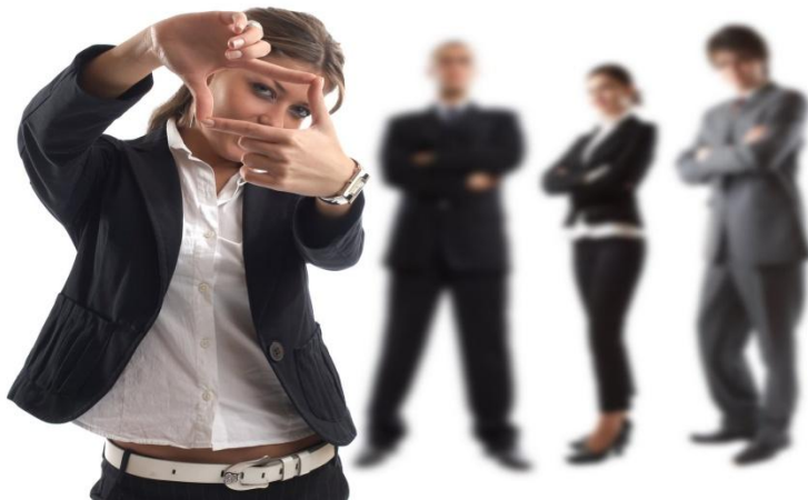
Εικόνα 3 : Νεανική επιχειρηματικότητα

Για να εμπλουτιστεί η αγορά με φρέσκιες και νέες ιδέες, δόθηκε μεγάλη έμφαση στην επιχειρηματικότητα των νέων. Μια σειρά από προγράμματα δίνουν το έναυσμα για την υποστήριξη, ανάπτυξη και την προώθηση της. Με χρηματοδοτικές ενισχύσεις προσπαθούν διάφοροι φορείς για τη δημιουργία νέων επιχειρήσεων, οι οποίες θα εξελιχθούν σε βιώσιμες.