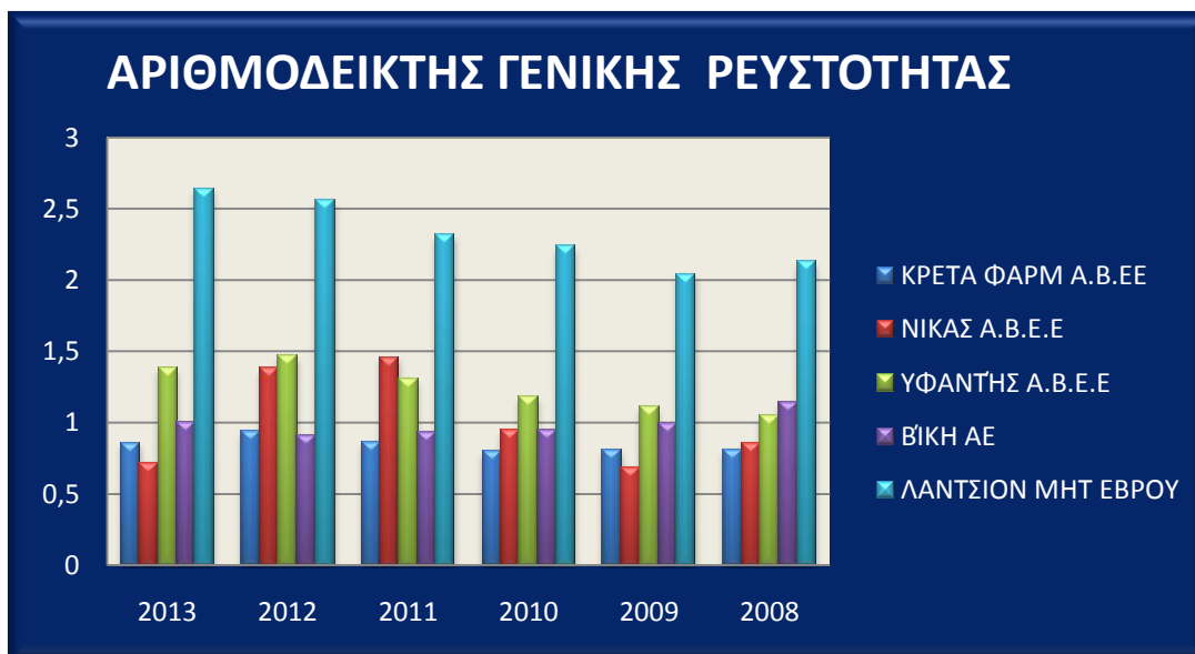
Διάγραμμα 1.Αριθμοδείκτης γενικής ρευστότητας των εταιρειών ΚΡΕΤΑ ΦΑΡΜ, ΝΙΚΑΣ Α.Β.Ε.Ε,ΥΦΑΝΤΗΣ Α.Β.Ε.Ε, ΒΙ.Κ.Η Α.Ε, ΛΑΝΤΣΙΟΝ ΜΗΤ ΕΒΡΟΥ

Στον πίνακα 2 εξετάζεται ο αριθμοδείκτης άμεσης ρευστότητας. Ο εν λόγω δείκτης αποτελεί καλύτερη ένδειξη ρευστότητας για την επιχείρηση από τον δείκτη γενικής ρευστότητας.Μια τιμή γύρω στο (1,5) θεωρείται ικανοποιητική για μια επιχείρηση.