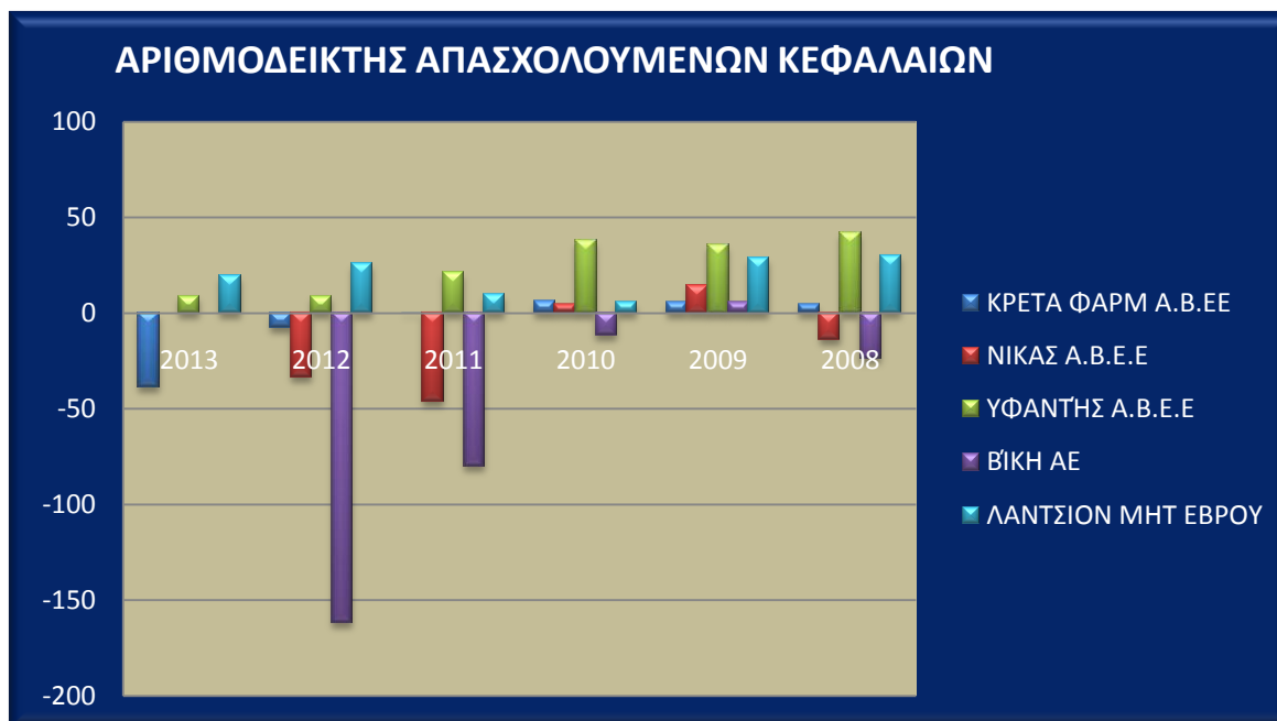
Πίνακας 9.Αριθμοδείκτης κεφαλαιακής διάρθρωσης