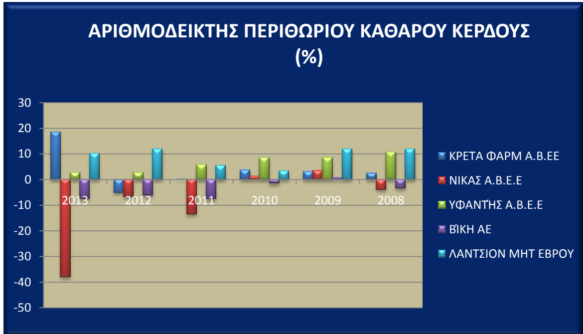
Διάγραμμα 12. Αριθμοδείκτης καθαρού περιθωρίου κέρδους των εταιρειών ΚΡΕΤΑ ΦΑΡΜ, ΝΙΚΑΣ Α.Β.Ε.Ε, ΥΦΑΝΤΗΣ Α.Β.Ε.Ε, ΒΙ.Κ.Η Α.Ε., ΛΑΝΤΣΙΟΝ ΜΗΤ ΕΒΡΟΥ