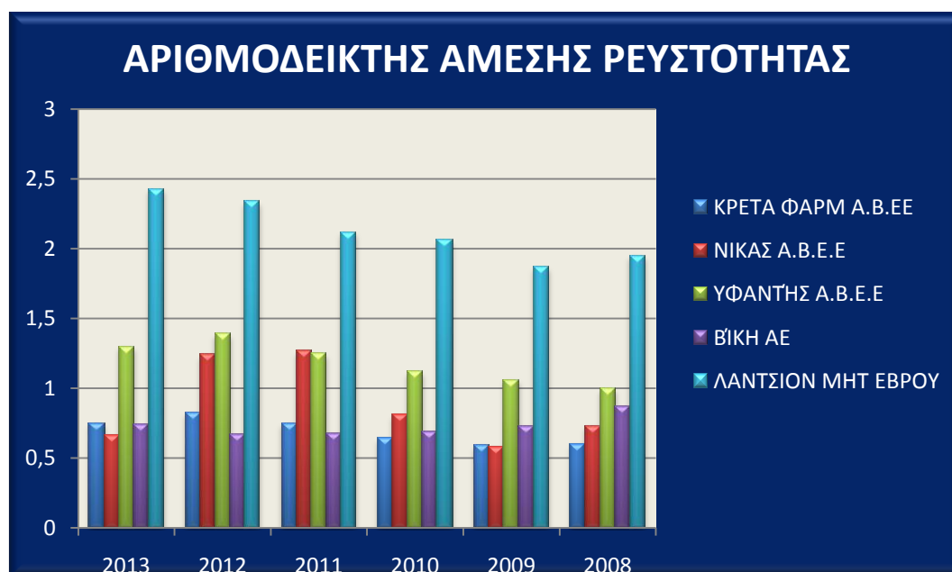
Διάγραμμα 2.Αριθμοδείκτης άμεσης ρευστότητας των εταιρειών ΚΡΕΤΑ ΦΑΡΜ, ΝΙΚΑΣ Α.Β.Ε.Ε,ΥΦΑΝΤΗΣ Α.Β.Ε.Ε, ΒΙ.Κ.Η Α.Ε, ΛΑΝΤΣΙΟΝ ΜΗΤ ΕΒΡΟΥ

Στον πίνακα 3 εξετάζεται ο αριθμοδείκτης ταμειακής ρευστότητας. Ο εν λόγω δείκτης ελέγχει αν τα διαθέσιμα περιουσιακά στοιχεία μιας επιχείρησης επαρκούν για να καλύψουν τις βραχυπρόθεσμες υποχρεώσεις της. Μια τιμή μεγαλύτερη την μονάδας (1) θεωρείται ικανοποιητική.