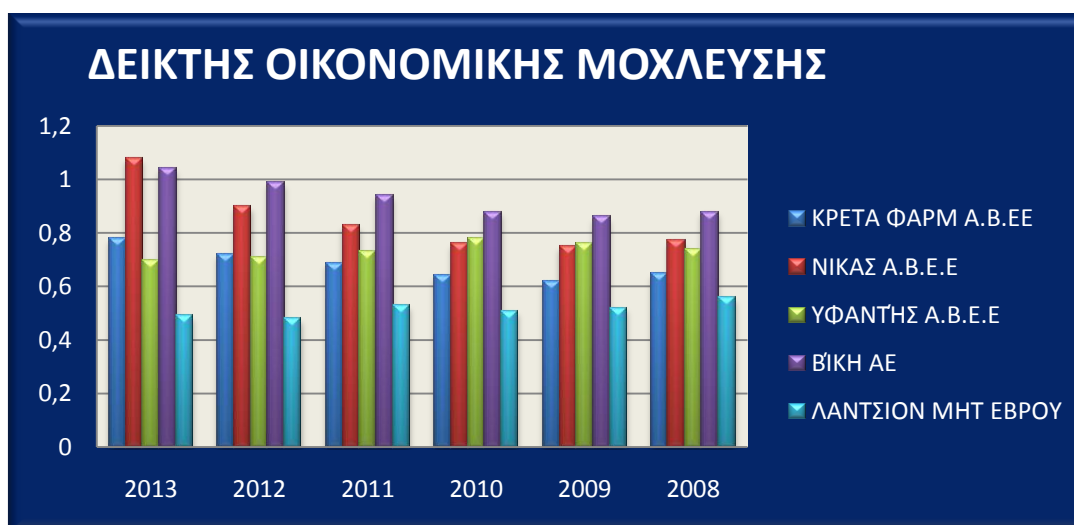
Πίνακας 5.Αριθμοδείκτης βιωσιμότητας σχέση ιδίων προς ξένων κεφαλαίων