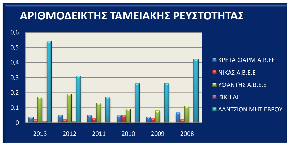
Διάγραμμα 3. Αριθμοδείκτης ταμειακής ρευστότητας των εταιριών ΚΡΕΤΑ ΦΑΡΜ, ΝΙΚΑΣ Α.Β.Ε.Ε, ΥΦΑΝΤΗΣ Α.Β.Ε.Ε, ΒΙ.Κ.Η Α.Ε, ΛΑΝΤΣΙΟΝ ΜΗΤ ΕΒΡΟΥ

Παρακάτω απεικονίζεται διαγραμματικά η πορεία του δείκτη ταμειακής ρευστότητας των υπό εξέταση εταιριών.