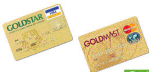
GoldStar & GoldMast