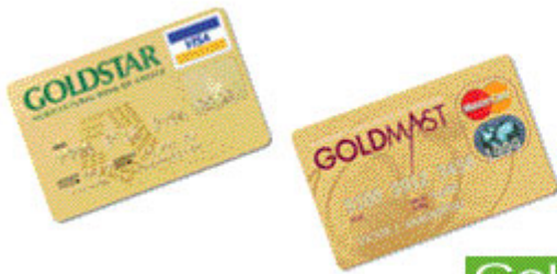
GoldStar & GoldMast