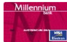
Visa Electron για Φοιτητές