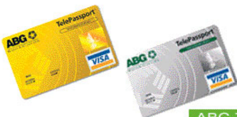
ABG TELEPASSPORT VISA