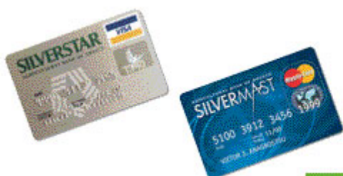
SilverStar & SilverMast