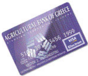
Student ELECTRON Visa