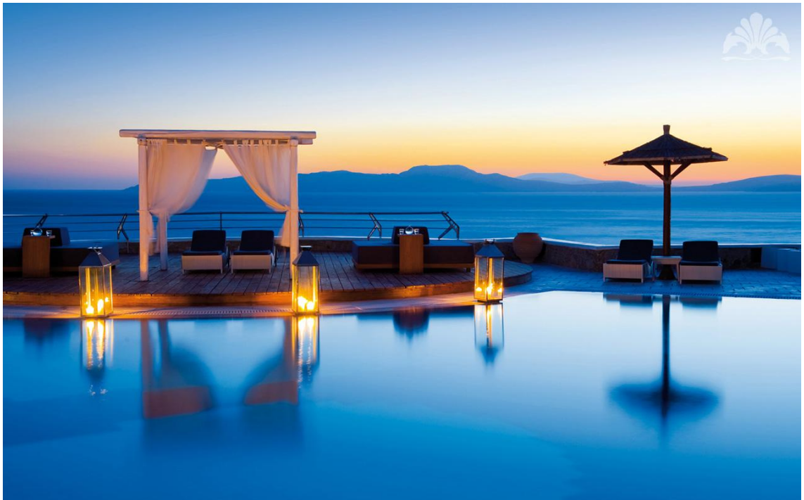
Εικόνα 5: Η θέα του ξενοδοχείου

Το ξενοδοχείο χρησιμοποιεί ηλιακά πάνελ και αντλίες θερμότητας για να έχει ζεστό νερό για τους πελάτες του. Το ξενοδοχείο αναπτύσσει και ένα καινούργιο project με γεωθερμία. Όλα τα κλιματιστικά που διαθέτει το ξενοδοχείο είναι inverter και κλάσης A+++ , έτσι ώστε να εξοικονομούν ενέργεια. Επίσης, τα περισσότερα ψυγεία του ξενοδοχείου είναι ενεργειακής κλάσης A. Επιπλέον, όλα τα δωμάτια διαθέτουν σύστημα εξοικονόμησης ενέργειας το οποίο ενεργοποιείται με κάρτα. Για να έχει το δωμάτιο ρεύμα ο επισκέπτης θα πρέπει να τοποθετήσει την κάρτα αυτή μέσα στην ειδική εγκοπή.