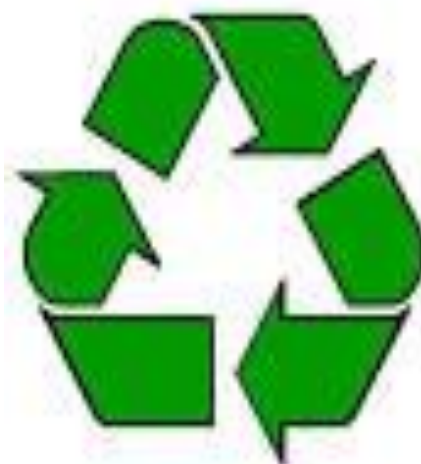
Εικόνα 1: Ανακύκλωση