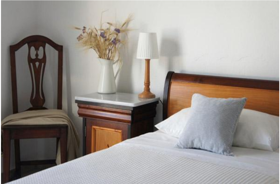
Εικόνα 7: Δωμάτια του ξενοδοχείου

Διενεργήθηκε μία ακόμα συνέντευξη στο συγκεκριμένο ξενοδοχείο προκειμένου να διαπιστωθεί αν το ξενοδοχείο προστατεύει το φυσικό περιβάλλον και με ποιους τρόπους. Η συνέντευξη παραχωρήθηκε από τον κ. Ανδρέα Ν. Φιορεντίνο, ιδιοκτήτη και διευθύνων σύμβουλο του ξενοδοχείου. Έτσι, από την συνέντευξη αυτή προκύπτει ότι το ξενοδοχείο δεν είναι "πράσινο", παρά μονάχα διαθέτει πάνω από 200 δέντρα και θάμνους. Το ξενοδοχείο πραγματοποιεί ανακύκλωση μόνο στα πλαστικά. Το ξενοδοχείο δεν περιέχει εστιατόριο οπότε δεν πραγματοποιεί κομποστοποίηση στην κουζίνα του.