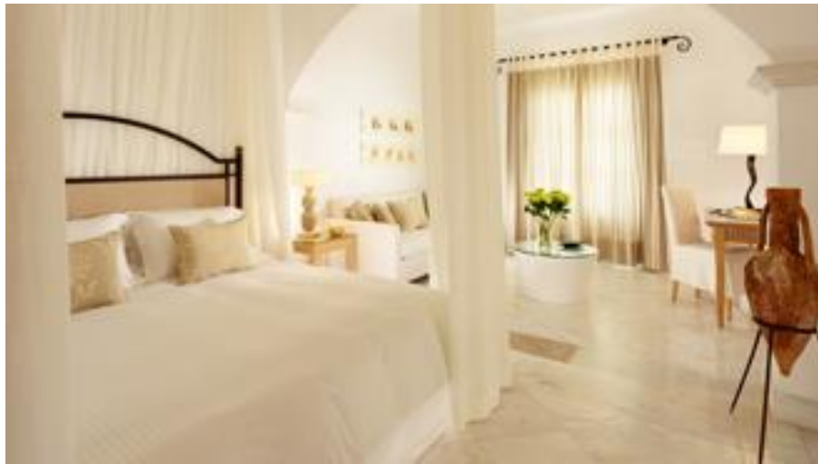
Εικόνα 4: Δωμάτια του ξενοδοχείου

Διενεργήθηκε μία συνέντευξη στο συγκεκριμένο ξενοδοχείο προκειμένου να διαπιστωθεί αν το ξενοδοχείο προστατεύει το φυσικό περιβάλλον και με ποιους τρόπους. Η συνέντευξη παραχωρήθηκε από τον operating manager του ξενοδοχείου. Έτσι, από την συνέντευξη αυτή προκύπτει ότι το ξενοδοχείο είναι "πράσινο". Το ξενοδοχείο πραγματοποιεί ανακύκλωση στα χαρτιά/ χαρτόνια, στα γυαλιά και στα πλαστικά. Επίσης, το ξενοδοχείο ανακυκλώνει τις μπαταρίες και τα φωτιστικά είδη που διαθέτει. Σημαντικό είναι επίσης, ότι το ξενοδοχείο κάνει κομποστοποίηση κυρίως στα φαγητά.