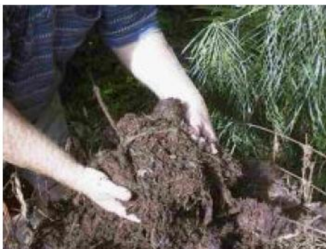
Εικόνα 2: Κομποστοποιημένο υλικό