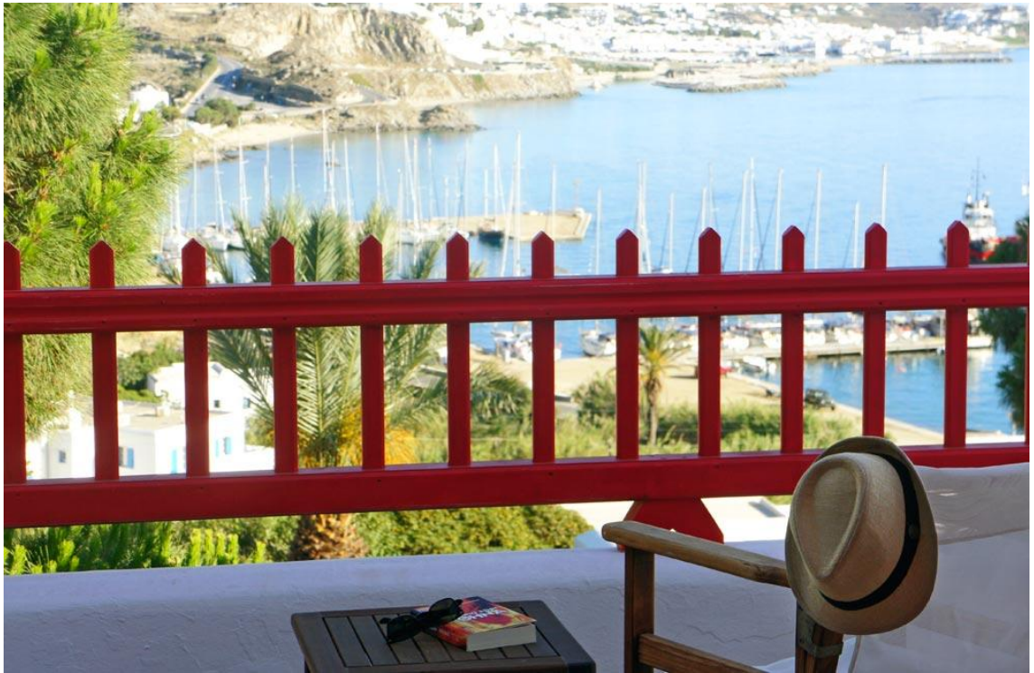
Εικόνα 8: Η θέα του ξενοδοχείου

Το ξενοδοχείο χρησιμοποιεί καυστήρα με πετρέλαιο για να ζεστάνει το νερό για τους πελάτες του. Διαθέτει επίσης, τηλεοράσεις 32 ιντσών τεχνολογίας led για εξοικονόμηση ενέργειας. Έχει θερμομονωτικά κουφώματα και μπαλκονόπορτες γερμανικού τύπου. Το ξενοδοχείο δεν αλλάζει τις πετσέτες κάθε ημέρα με συνεννόηση με τους πελάτες προκειμένου να επαναχρησιμοποιούνται και να μην σπαταλιέται ενέργεια. Τέλος, δεν διαθέτει κάποιο σύστημα εξοικονόμησης νερού.