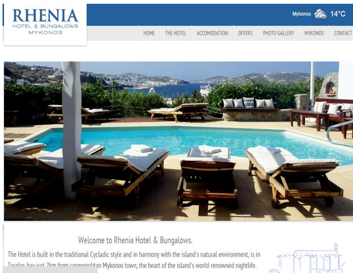
Εικόνα 6: Ιστοσελίδα ξενοδοχείου

Το ξενοδοχείο αυτό περιλαμβάνει δυνατότητα για online κρατήσεις, wi-fi, εξωτερική πισίνα, ενοικιαζόμενα ποδήλατα και μηχανάκια, μεταφορά από και προς το αεροδρόμιο, πάρκινγκ κ.ά. Διαθέτει δωμάτια μονόκλινα, οικογενειακά και Bungalows.