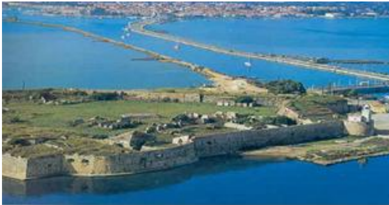
Εικόνα 4.1 Κάστρο Αγίας Μαύρας