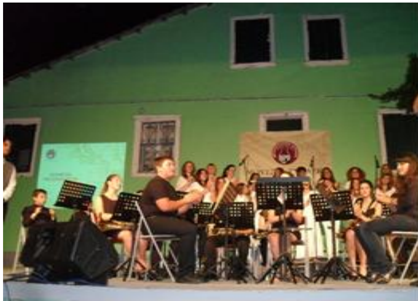
Εικόνα 4.3 Κηποθέατρο Άγγελου Σικελιανού

Οι χώροι που λαμβάνουν χώρα οι πολιτιστικές δράσεις των συλλόγων ποικίλουν, ωστόσο ένας από τους χώρους που χρησιμοποιείται ευρέως για παραστάσεις είναι το Κηποθέατρο του Άγγελου Σικελιανού. Τον χώρο αυτό τον 'εκμεταλλεύονται' τόσο οι χορευτικοί σύλλογοι, όσο και οι παιδικές θεατρικές ομάδες, αλλά και επαγγελματικοί θίασοι. Ο Άγγελος Σικελιανός ήταν ποιητής με καταγωγή από τη Λευκάδα έχει πλούσια συγγραφική δραστηριότητα προς τιμήν του οποίου η οικία του στη Λευκάδα μετατράπηκε σε μουσείο, ενώ το Κηποθέατρο της Λευκάδας φέρει το όνομά του.