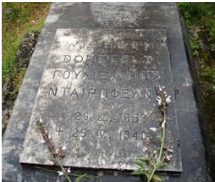
Εικόνα 4.2 Τάφος αρχαιολόγου Δαίρπφελδ

χώρος έχει κηρυχθεί η περιοχή από το βουνό Σκάρος έως την περιοχή Μαγεμένος Νικιάνας καθώς κατά μήκος της ευρύτερης περιοχής απαντώνται τύμβοι της Πρωτοελλαδικής περιόδου, τάφοι με κεραμοσκεπή, καθώς επίσης υπάρχουν τμήματα αρχαίων οικοδομημάτων στην περιοχή του Περιγιαλιού και του Κολωνίου. Οι παραπάνω αρχαιολογικοί χώροι αποτελούν ευρήματα που χρονολογούνται από τους προϊστορικούς έως τους ρωμαϊκούς χρόνους. Ο αρχαιολόγος Δαίρπφελδ έφερε στο φως τα προαναφερθέντα αρχαιολογικά μνημεία και ο τάφος του βρίσκεται στην της χερσονήσου του Βλυχού, αποτελώντας αρχαιολογικό μνημείο του νησιού.