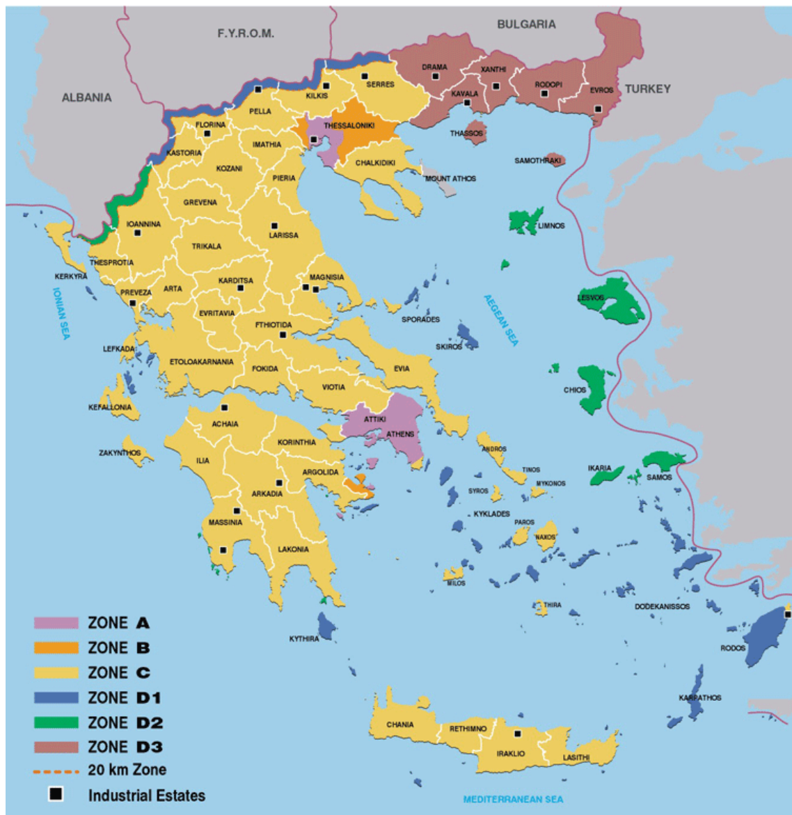
Εικόνα 2.5. ΧΑΡΤΗΣ ΕΠΕΝΔΥΤΙΚΩΝ ΖΩΝΩΝ