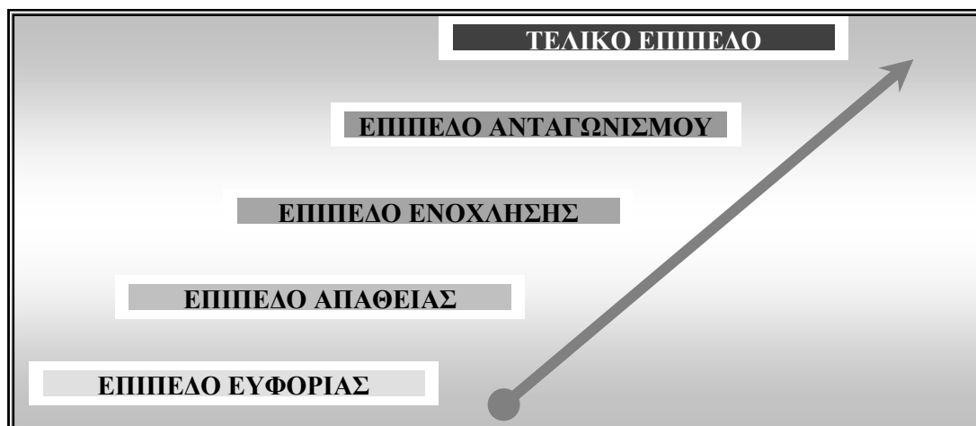
Σχεδιάγραμμα 1.5.1α: Προκαλούμενα Επίπεδα Ενοχλήσεων από Συναντήσεις Τουριστών – Ντόπιων