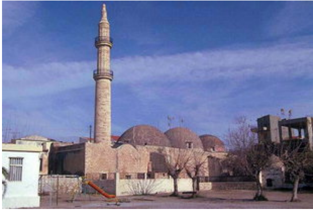
Το Τζαμί Νερατζέ στο Ρέθυμνο

Ένας μεγάλος αριθμός εντυπωσιακών Τουρκικών Τζαμιών σώζεται ακόμα στην πόλη του Ρεθύμνου. Το τζαμί Ιμπραήμ Χαν (Βενετικός καθεδρικός ναός που τροποποιήθηκε από τους Τούρκους) είναι επίσης αξιοσημείωτο.