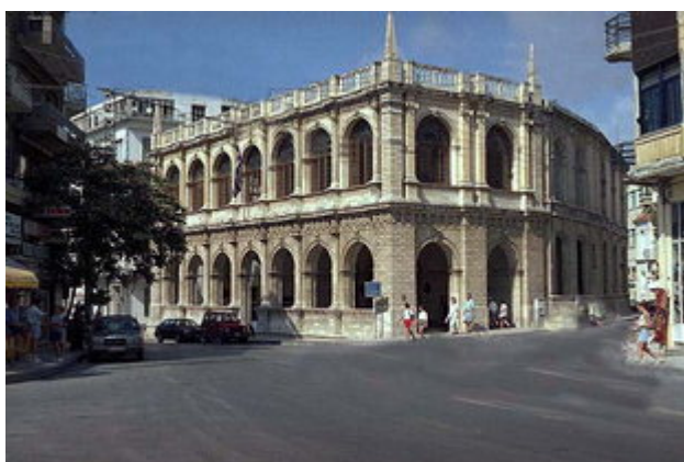
Η Βενετική Λότζια στο Ηράκλειο