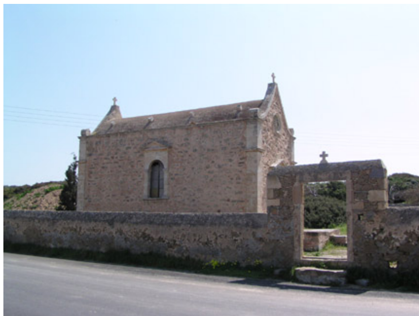
Η Βενετική εκκλησία του Τιμίου Σταυρού, Μονή Τοπλού

Υπάρχουν ιστορικές μαρτυρίες για την ύπαρξη στην Κρήτη πάνω από 5.000 Βυζαντινών και Βενετικών Εκκλησιών. Οι Βυζαντινές εκκλησίες χτίστηκαν κατά τη διάρκεια της Πρώτης και της Δεύτερης Βυζαντινής Περιόδου καθώς και κατά τη διάρκεια της Βενετοκρατίας (13ος - 17ος αιώνας). Είναι δύσκολο να διαχωριστούν πλήρως οι Ελληνορθόδοξες από τις Καθολικές εκκλησίες. Η ίδια εκκλησία μπορεί να έχει χρησιμοποιηθεί για οποιοδήποτε από τα δύο