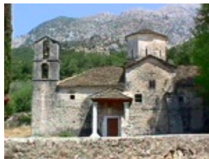
Μονή Αγ. Γεωργίου, Καμίτσανη