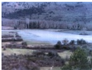
Ο ποταμός Καλαμάς