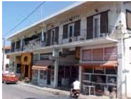
Το Δημαρχείο Φιλιατών

Υδροδότηση : τη θερινή περίοδο παρατηρείται σε ορισμένα δημοτικά διαμερίσματα λειψυδρία καθώς αυξάνονται οι ανάγκες σε νερό. Επίσης απαραίτητη είναι η χλωρίωση του νερού στις κεντρικές δεξαμενές με χλωριοτήρα , ώστε να είναι απαλλαγμένο από μικροοργανισμούς και ιδιαίτερα στις κοινότητες με χαμηλό υψόμετρο. Αναγκαία είναι η προσπάθεια ανεύρεσης νέων υδάτινων πηγών ώστε να λυθεί το πρόβλημα της υδροδότησης του νεοσύστατου δήμου.