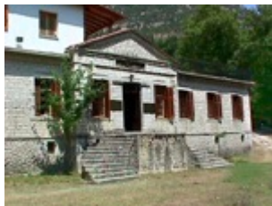
Λαογραφικό Μουσείο Τσαμαντά