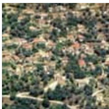
Εικόνες από την Ορεινή Θεσπρωτία