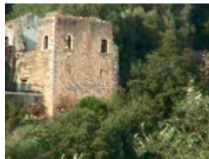
Παλιό πυργόσπιτο στο Φοινίκι