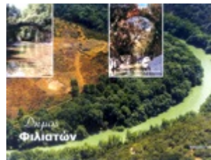
Απο τα αξιοθέατα της περιοχής