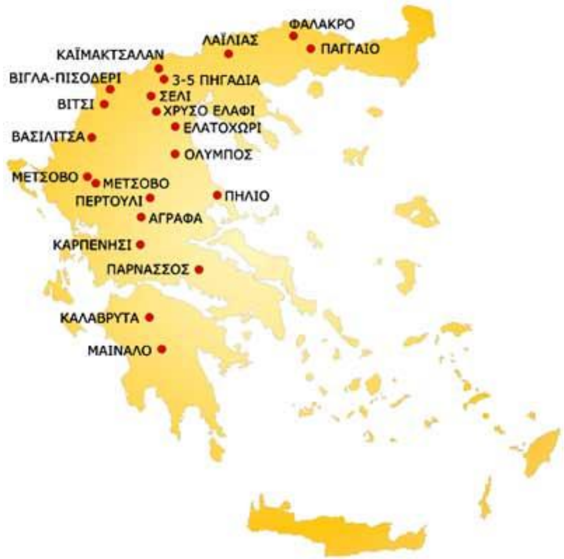
Εικόνα 1: Χάρτης χιονοδρομικών κέντρων Ελλάδας

Παρακάτω παρουσιάζονται τα χιονοδρομικά κέντρα της Ελλάδας, καθώς και τα βασικά τους χαρακτηριστικά: