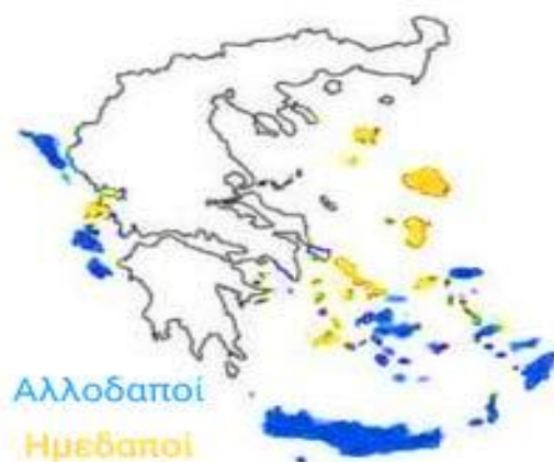
Εικόνα 3.1. Χάρτης εξειδίκευσης αφίξεων στις νησιωτικές περιφέρειες της χώρας