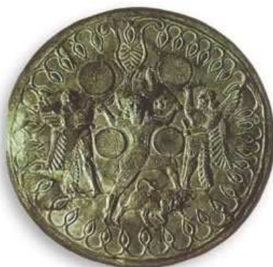
Χάλκινη ασπίδα με τους Κουρήτες που χτυπούν τις ασπίδες τους.

Για την ακρίβεια η Ρέα έκρυψε στο σπήλαιο αυτό το νεογέννητο μωρό της για να το γλιτώσει από τη μανία του Κρόνου να καταβροχθίζει τα παιδιά του, επειδή φοβόταν ότι κάποιο απ' αυτά θα του έπαιρνε την εξουσία. Κρυμμένος στην σπηλιά ο Δίας μεγάλωνε με το γάλα της κατσίκας Αμάλθειας ενώ όταν έκλαιγε οι Κουρήτες κάλυπταν τις φωνές του χτυπώντας δυνατά τις χάλκινες ασπίδες τους.