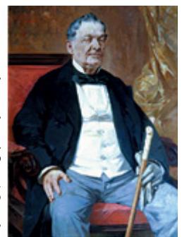
Γεώργιος Σταύρος (1841-1869)

Η Εθνική Τράπεζα της Ελλάδος Α.Ε. ιδρύθηκε το 1841 και εισήχθη στο Χρηματιστήριο Αξιών Αθηνών το 1880. Με 160 πλέον χρόνια επιτυχούς και αδιάλειπτης λειτουργίας στον οικονομικό βίο της χώρας, η Τράπεζα έχει εξελιχθεί σε ένα σύγχρονο και ολοκληρωμένο όμιλο εταιρειών παροχής χρηματοπιστωτικών υπηρεσιών, καλύπτοντας έτσι τις συνεχώς διευρυνόμενες ανάγκες των πελατών της. Στο πλαίσιο αυτό, η Τράπεζα ίδρυσε το 1891 την Ελληνική Εταιρεία Γενικών Ασφαλίσεων «Η Εθνική» και το 1927 την Εθνική Κτηματική Τράπεζα.