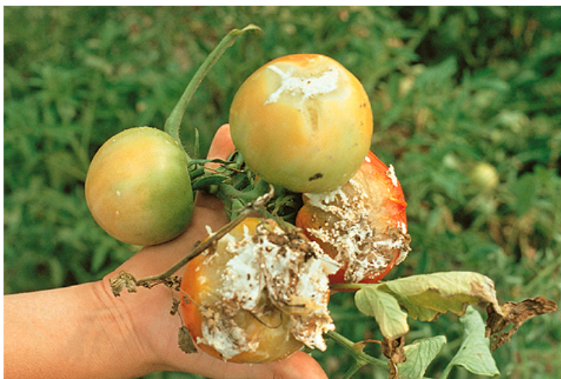
Εικ.17. Σήψη καρπών από τον Sclerotinia sclerotiorum .

Η μόλυνση εμφανίζεται συχνά στην περιοχή του λαιμού των φυτών, ως υδατώδης μεταχρωματισμός των ιστών που σύντομα εξαπλώνεται προς το στέλεχος πάνω από την επιφάνεια του εδάφους και στη ρίζα. Σχηματίζεται εκτεταμένο, μαλακό, υπόλευκο μέχρι στακτόχροο έλκος που όταν περιβάλλει το στέλεχος, το φύλλωμα του φυτού πάνω από την προσβολή γίνεται χλωρωτικό, μαραίνεται και ξηραίνεται.