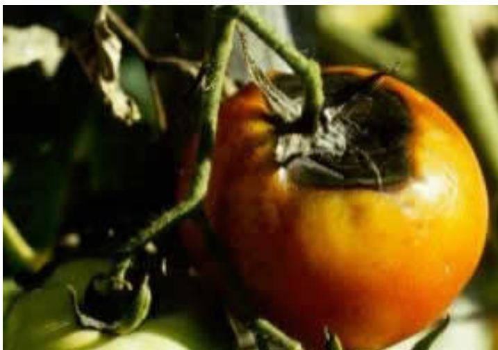
Εικ.19. Προσβολή καρπών τομάτας οφειλόμενη στον Didymella lycopersici .

Μεταδίδεται με το σπόρο και τον αέρα. Στο υγιές φυτό εισχωρεί από τους γηρασμένους ιστούς ή τις πληγές και για το λόγο αυτό τα πληγωμένα και εξασθενημένα φυτά είναι πιο ευπαθή. Η υπερβολική αζωτούχος λίπανση, η πυκνή φύτευση και ο συννεφιασμένος καιρός ευνοούν τη μόλυνση των φυτών.