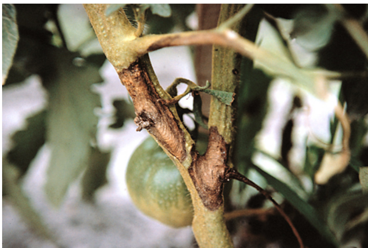
Εικ.11. Αλτερναρίωση. Συμπτώματα σε στελέχη τομάτας.

Ξενιστές: Τομάτα, μελιτζάνα, πιπεριά, πατάτα και πολλά αυτοφυή σολανώδη καθώς και είδη του γένους Brassica .