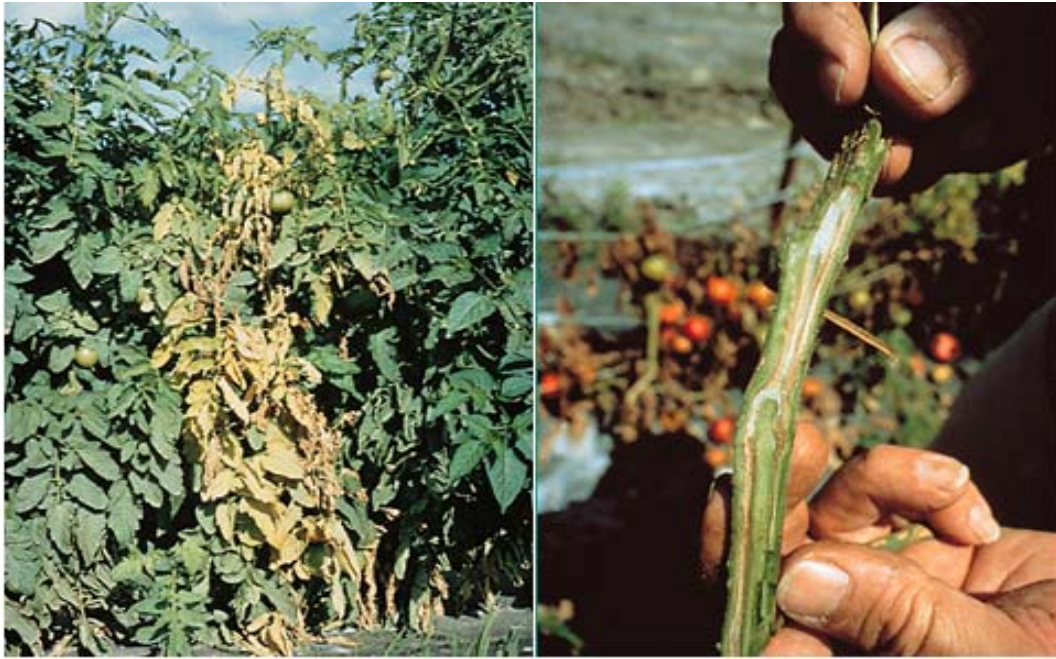
Εικ.2. Συμπτώματα αδροφουζαρίωσης τομάτας.