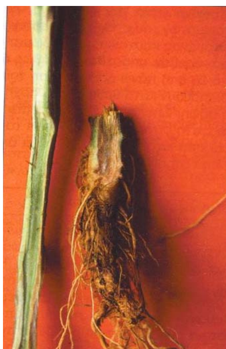
Εικ.6. Συμπτώματα προσβολής τομάτας από τον Fusarium oxysporum f. sp. radicis - lycopersici . Διακρίνεται ο καστανός μεταχρωματισμός στα αγγεία του στελέχους της περιοχής του λαιμού.

Στο θερμοκήπιο, η ασθένεια εκδηλώνεται με ένα απότομο μαρασμό των φυτών λίγο προ της ωριμάσεως των πρώτων καρπών. Στις υπαίθριες καλλιέργειες, η ασθένεια εκδηλώνεται με απότομο μαρασμό και βαθμιαία ξήρανση των φύλλων. Στο λαιμό των αναπτυγμένων φυτών παρατηρείται μια καστανή σήψη του φλοιώδους ιστού, η οποία συνήθως γίνεται αντιληπτή μόνο μετά την αφαίρεση, με ένα μαχαίρι, του φλοιού του στελέχους. Επίσης, στην περιοχή του λαιμού παρατηρείται ένας καστανός μεταχρωματισμός των αγγείων του ξύλου που προχωρεί σε απόσταση συνήθως 5-10 cm πάνω από τη βάση του στελέχους. Στην αρχή παρατηρείται μαρασμός των φύλλων της κορυφής, και στη συνέχεια μαραμα των κατώτερων φύλλων, κιτρίνισμα που αρχίζει απ' την κορυφή του ελάσματος και τελικά ξήρανση.