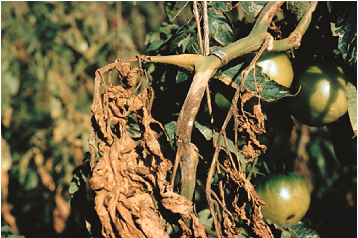
Εικ.13. Έλκη στο στέλεχος τομάτας από τον Botrytis cinerea .

Προσβάλλει λαιμούς, στελέχη, φύλλα, καρπούς, μίσχους σε φυτά κάθε ηλικίας. Οι προσβολές αρχίζουν από το σπορείο. Οι ιστοί που έχουν προσβληθεί από την τεφρά σήψη γίνονται μαλακοί, συρρικνώνονται νεκρώνονται και καλύπτονται από την γκριζοπράσινη εξάνθηση του μύκητα που αποτελείται από τους κονιδιοφόρους και τα κονίδια. Τα φυτά που έχουν μολυνθεί μαραίνονται και ξηραίνονται.