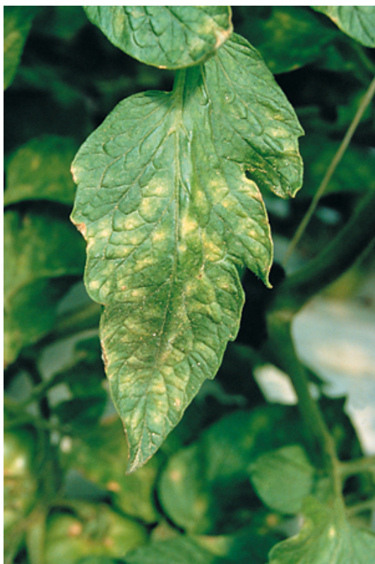
Εικ.15. Προσβολή του Fulvia fulva σε φύλλα τομάτας. Συμπτώματα στην πάνω επιφάνεια του ελάσματος.

Η ασθένεια προκαλείται από το μύκητα Fulvia fulva . Ο μύκητας επιβιώνει σε τεμάχια ξηρών ιστών του φυλλώματος και στα υπολείμματα της καλλιέργειας σαπροφυτικά και στο έδαφος και στα διάφορα μέρη του θερμοκηπίου ως σκληρώτια και ως κονίδια. Η είσοδος του παθογόνου στα φύλλα γίνεται μόνο από τα στομάτια.