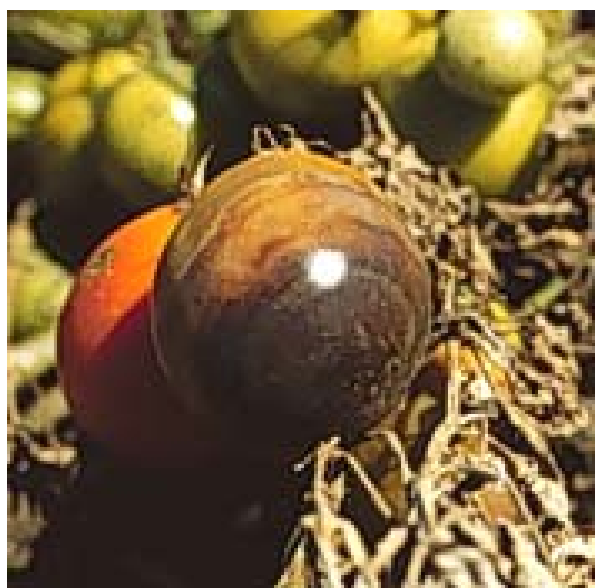
Εικ.7. Προσβολή καρπού τομάτας οφειλόμενη στον Phytophthora spp.

Η προσβολή του λαιμού εκδηλώνεται στη βάση του στελέχους ως υδατώδης επιμήκης κηλίδα που σύντομα γίνεται πρασινοκαστανή ή καστανή και ο φλοιός γίνεται μαλακός και βυθίζεται. Συχνά η μόλυνση αρχίζει από τις ρίζες. Όταν η προσβολή περιβάλει το στέλεχος τα φυτά μαραίνουν απότομα και ξηραίνονται. Στους καρπούς, ιδίως σ' αυτούς που