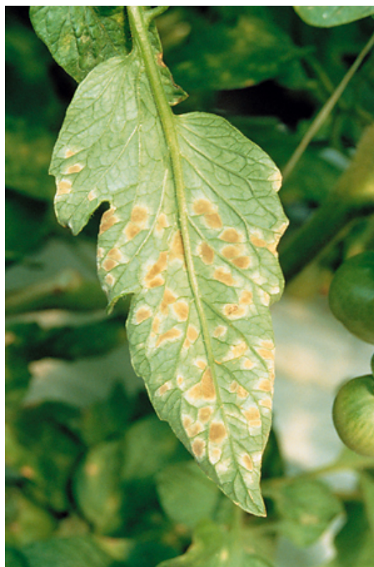
Εικ.16. Προσβολή του Fulvia fulva σε φύλλα τομάτας. Συμπτώματα στην κάτω επιφάνεια του ελάσματος.