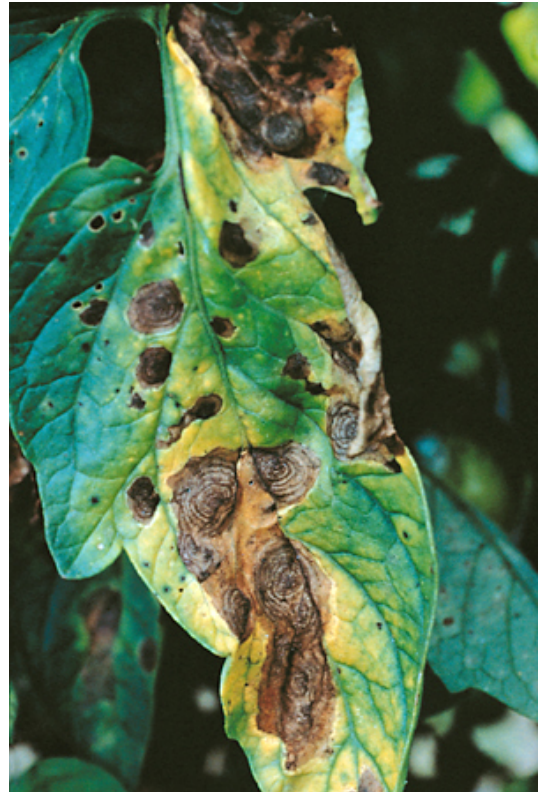
Εικ.12. Αλτερναρίωση. Συμπτώματα σε φύλλο τομάτας.