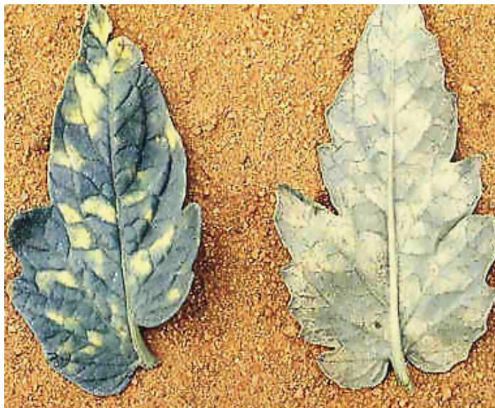
Εικ.20. Συμπτώματα προσβολής από το μύκητα Leveillula taurica στην πάνω και κάτω επιφάνεια φύλλων τομάτας.

Ξενιστές: Περίπου 100 είδη φυτών (τομάτα, μελιτζάνα, πιπεριά, πατάτα, αγγουριά, κολοκυθιά, μπάμια, αγκινάρα, ελιά, πολλά καλλωπιστικά καθώς και ζιζάνια).