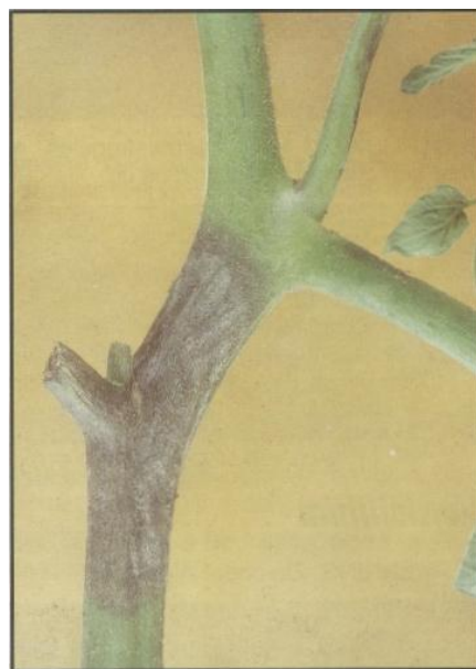
Εικ.9. Συμπτώματα περονόσπορου σε τρυφερούς βλαστούς τομάτας.

Προσβάλλονται όλα τα εναέρια όργανα των φυτών, σ' όλα τα στάδια αναπτύξεως. Στο έλασμα των φύλλων εμφανίζονται, στην αρχή υποκίτρινες ή υδατώδεις, ακανόνιστου σχήματος κηλίδες (λαδιές) οι οποίες αποκτούν γρήγορα καστανόμαυρο χρώμα. Οι κηλίδες εμφανίζονται συνήθως στην περιφέρεια ή την κορυφή του ελάσματος και με υγρό καιρό γρήγορα επεκτείνονται σ' όλη την επιφάνεια του ελάσματος, ενώ στην κάτω επιφάνεια σχηματίζονται οι υπόλευκες εξανθήσεις των σποριαγγειοφόρων του παθογόνου. Στους μίσχους των φύλλων και στους βλαστούς εμφανίζονται μαύρες νεκρωτικές επιμήκεις κηλίδες που σύντομα καλύπτουν μεγάλες επιφάνειες των προσβεβλημένων οργάνων και προκαλούν το μαρασμό και την αποξήρανσή τους. Εφ' όσον επικρατεί υγρός καιρός οι προσβεβλημένες περιοχές, καλύπτονται από τις υπόλευκες εξανθήσεις του μύκητα.