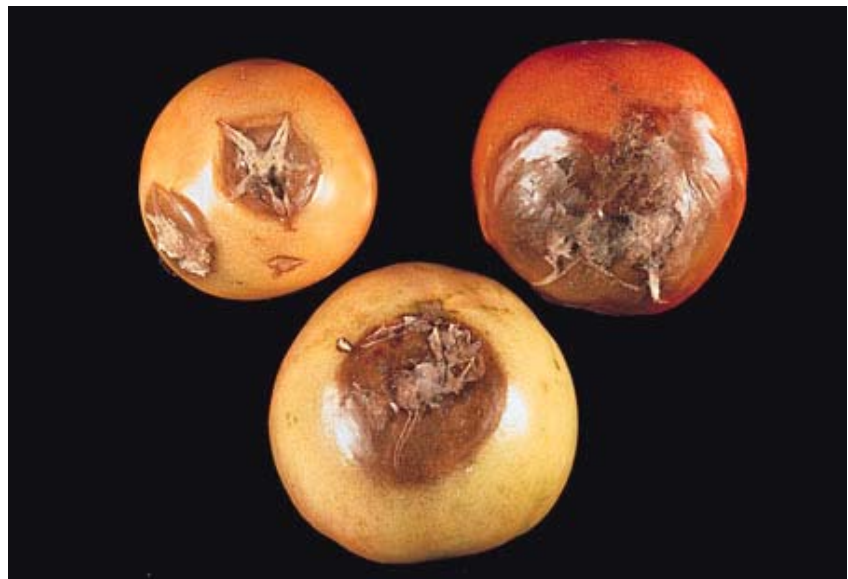
Εικ.5. Προσβολή καρπών τομάτας από το Rhizoctonia solani .

Τα προσβεβλημένα φυτά παρουσιάζουν καχεξία, συχνά χλώρωση, καρούλιασμα φύλλων και τελικά, αν το έλκος περιβάλλει το στέλεχος, αποξηραίνονται.