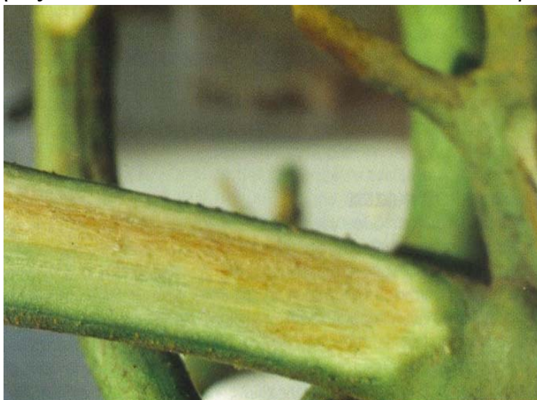
Εικ.1. Καστανός μεταχρωματισμός των αγγείων στελέχους τομάτας λόγω προσβολής από τον Verticillium dahliae .

Ξενιστές: Περισσότερα από 265 είδη καλλιεργούμενων και αυτοφυών φυτών. Στη χώρα μας ο μύκητας V. dahliae είναι ένα από τα σπουδαιότερα παθογόνα του αγγειακού συστήματος των ανώτερων φυτών. Μεταξύ των λαχανοκομικών ειδών που προσβάλλονται συνήθως από το V. dahliae είναι η τομάτα, η πατάτα, η μελιτζάνα, η πιπεριά, η μπάμια, η αγγουριά, η πεπονιά, κ.ά.