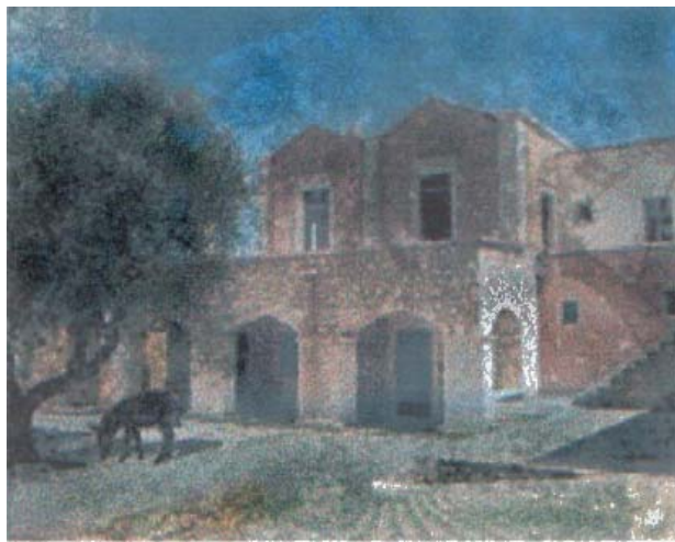
Η αγροικία στο αγρόκτημα Agreco.

Γύρω από μια αγροικία έχει διαμορφωθεί ένα μικρό παραδοσιακό κρητικό χωριό, με εκκλησία, καφενείο, μπακάλικο, ταβέρνα, τυροκομείο, κουζίνα και ξυλόφουρνο. Γύρω τους το κελάρι, το πατητήρι, το ρακοκάζανο, το μελίσσι, το ελαιοτριβείο, το αλώνι, ο νερόμυλος. Όλα λειτουργούν κανονικά και παράγουν ή προσφέρουν υπηρεσίες σε ανθρώπους που επιθυμούν να γνωρίσουν τη φύση και τις ομορφιές της. Το μπακάλικο, ένας τόπος μαγείας και οικολογικού shopping therapy. Η εκκλησία, το πάντρεμα της μοντέρνας τέχνης με το δέος για την ύψιστη αυτή οντότητα των Αγίων.