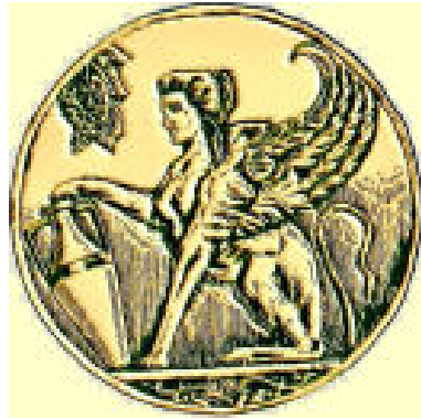
Λογότυπο Τοπικής Αυτοδιοίκησης Χίου.

Οι εκτυπώσεις είναι ένας τομέας που ο Νομός Χίου έχει επενδύσει στο παρελθόν υψηλά κονδύλια, συχνά εις βάρος των άλλων προωθητικών δράσεων. Οι εκτυπώσεις που χρηματοδοτήθηκαν από τη Νομαρχιακή Επιτροπή Τουριστικής Προβολής είναι: