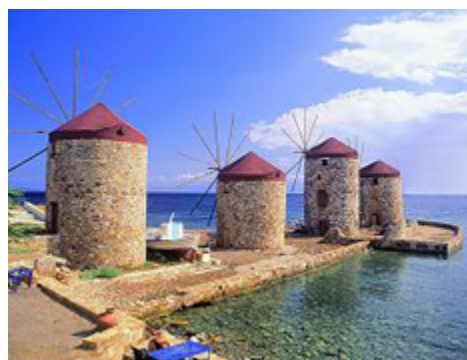
Τα Μυλαράκια στα Ταμπάκικα Χίου

Αυτό είναι το μέρος όπου φίλοι συναντιούνται, όπου τα νέα διαδίδονται, όπου οι χωρικοί πίνουν τον πρωινό τους καφέ ή το απογευματινό τους ούζο. Παρ' όλα αυτά είναι ένα ήρεμο και ήσυχο μέρος σε καθημερινή βάση, μετατρέπεται σε ένα κέντρο Βακχικών εκδηλώσεων της ημέρες που οι χωρικοί έχουν μια γιορτή. Νησιώτικα τραγούδια παίζονται από τους μουσικούς του χωριού άνδρες και γυναίκες κάθε ηλικίας χορεύουν μέχρι το ξημέρωμα, πίνουν κρασί και σουμά δικής τους παραγωγής.