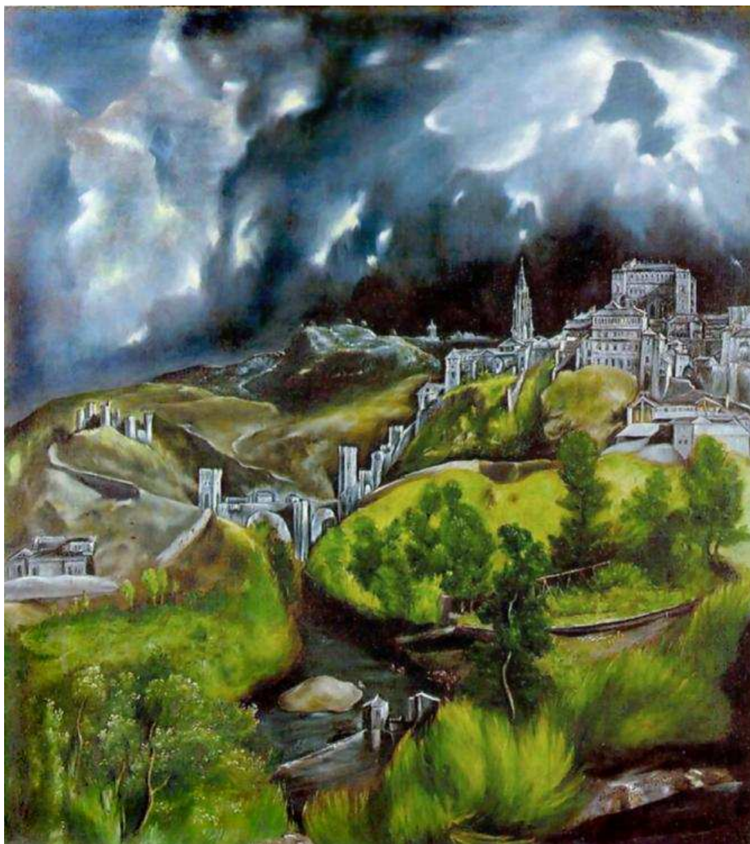
Άποψη και χάρτης του Τολέδου (1610-14, Σπίτι και Μουσείο Γκρέκο)