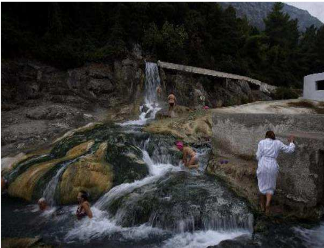
(Ιαματικά λουτρά σε φυσικούς καταράκτες στις Θερμοπύλες)

Δυστυχώς, όπως διαπιστώθηκε από την εκπόνηση της εργασίας όμως υπάρχει έλλειψη νομοθετικού πλαισίου, έλλειψη υποδομών και μελετών και ανυπαρξία ιδιωτικού ή δημόσιου φορέα που να ασχολείται με τον συγκεκριμένο κλάδο και ιδίως να διεκδικεί, να οργανώνει και να πραγματοποιεί μια ενιαία προσπάθεια για την ανάπτυξη του Τουρισμού υγείας στην Ελλάδα.