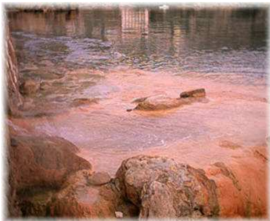
(Ιαματικές πηγές Αιδηψού)

Στα όρια της κοινότητας Τεμενίων βρίσκονται τα ερείπια της Μινωικής πόλης Υρτακίνας , η οποία ήταν χτισμένη σε υψόμετρο 900 μέτρα. Άλλα σημαντικά μνημεία του χωριού είναι η Βυζαντινή εκκλησία του Σωτήρος Χριστού του 14ου αιώνα με σπουδαία αρχιτεκτονική και τοιχογραφίες. Παράλληλα στο χωριό υπάρχουν ιαματικές πηγές και ένα, πρόσφατα ανακαινισμένο, υδροθεραπευτήριο.