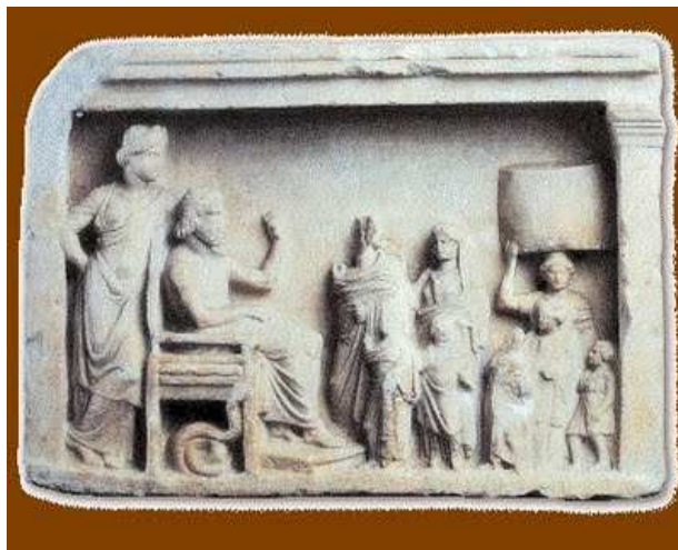
(οικογένεια με προσφορές προς τον Ασκληπιό και την Υγεία δευτερο μισό 4ου αι. π.Χ.)

Όσον αφορά την αρχαία Ελλάδα, οι Έλληνες χρησιμοποιούσαν τα λουτρά για την υγιεινή του σώματος, από το 1500π.Χ ,ενώ αργότερα διαδόθηκε ευρέως η χρήση των θαλάσσιων λουτρών. Η λουτροθεραπεία ήταν αρκετά διαδεδομένη στους Έλληνες εκείνης της εποχής, οι οποίοι επισκέπτονταν τις ιαματικές πηγές για να υποβληθούν σε θεραπείες, ενώ παράλληλα το συνδύαζαν με την αναψυχή τους και την κοινωνικοποίηση τους. Γνωστές ήταν οι ιαματικές πηγές της Χιμάρας, της Κασταλίας, της Σκοτούσας και της Αιδηψού. Αυτό μπορεί να θεωρηθεί ως προπομπός του σημερινού τουρισμού υγείας.