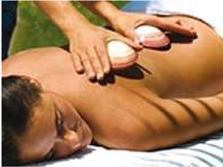
(Lava shell massage)