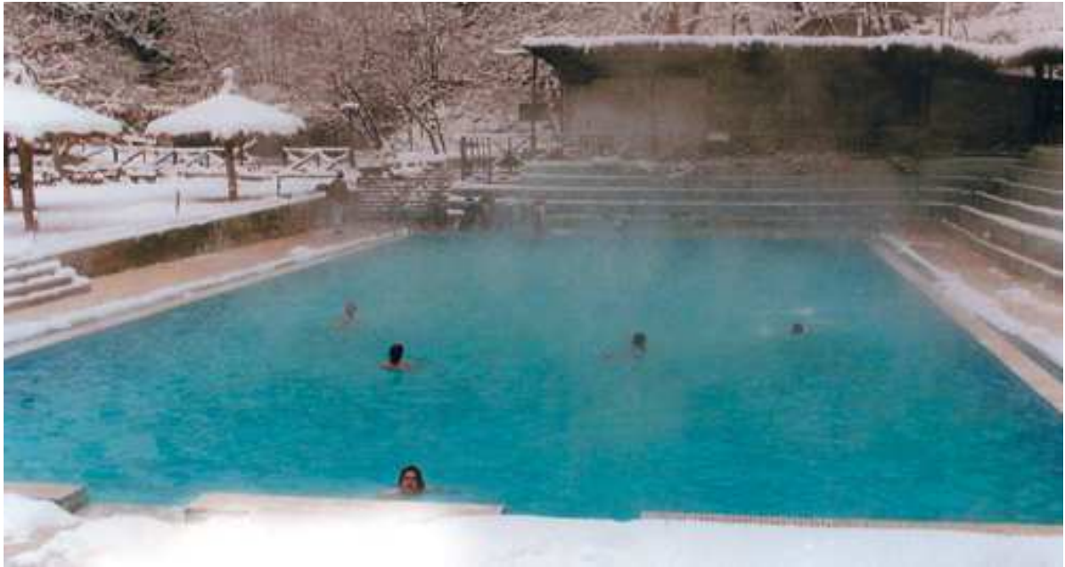
(Ιαματικά λουτρά Πόζαρ)

8) Νομός Θεσσαλονίκης Ιαματικά λουτρά Θέρμης : Ιδιαίτερο αρχαιολογικό ενδιαφέρον παρουσιάζουν οι εγκαταστάσεις των τριών τρούλαιων λουτρών εξαιρετης αισθητικής και οι έξι υπαίθριοι μαρμάρινοι ατομικοί λουτήρες. Ιαματικές πηγές Λαγκαδά Δημιουργήθηκαν εγκαταστάσεις που περιλαμβάνουν 23 αυτόματους λουτήρες, 2 μεγάλες πισίνες, φυσιοθεραπευτήριο και ιατρείο. Ιαματικά λουτρά Δήμου Απολλωνίας Σύγχρονες υδροθεραπευτικές εγκαταστάσεις με ομαδικούς και ατομικούς λουτήρες, πισίνα, σάουνα, χαμάμ, εισπνοθεραπευτήριο, υδρομασάζ.