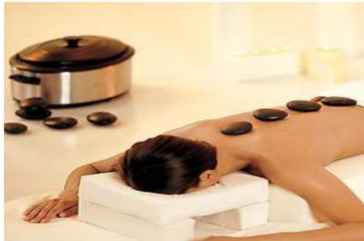
(Hot stone massage)

Έπειτα τοποθετούνται οι πέτρες και μόλις κάποια από αυτές χάσει τη θερμοκρασία της, αντικαθίσταται από άλλη. Οι πέτρες διαθέτουν διάφορα μεγέθη και σχέδια, αναλόγως το μέγεθος των μυών στους οποίους τοποθετούνται.