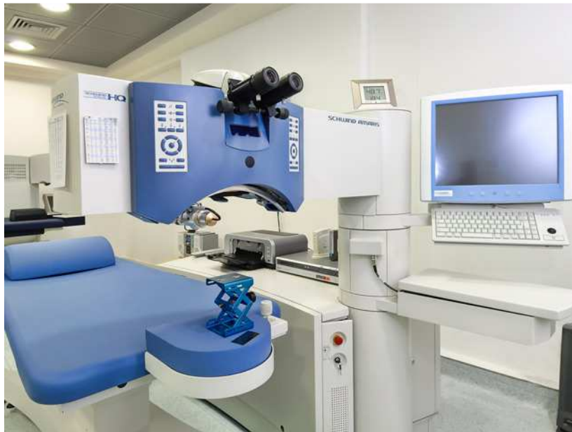
(Εργαστήριο του κέντρου «Εμμετρώπια»)

Βέβαια, υπάρχουν και άτομα σε νεαρή ηλικία, τα οποία δίνουν έμφαση στην εξωτερική τους εμφάνιση και γι' αυτό επιλέγουν να περάσουν τις διακοπές τους με το συγκεκριμένο τρόπο. Το ποσοστό ανδρών και γυναικών κυμαίνεται γενικά στα ίδια επίπεδα, καθ' ότι μεγάλος είναι ο αριθμός ζευγαριών που το κάνουν αυτό. Τέλος, αρκετά μεγάλο είναι το ποσοστό των ατόμων με ειδικές ανάγκες, τα οποία βρίσκονται σε κέντρα υγείας, προκειμένου να αποκαταστήσουν τα προβλήματα που αντιμετωπίζουν.