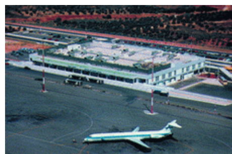
Το αεροδρόμιο των Χανίων

Ο τουρισμός αποτελεί επίσης μια βασική οικονομική δραστηριότητα στις μέρες μας για την Ελλάδα αλλά και για την Κρήτη. Τουρισμός είναι η βαριά βιομηχανία μας. Δυστυχώς όμως η μορφή του τουρισμού που έχει επικρατήσει σε όλη σχεδόν στην Ελλάδα είναι ο μαζικός τουρισμός. Επομένως και στο νομό Χανίων επικρατεί το πρόβλημα του οργανωμένου μαζικού και τελικά φτηνού, τουρισμού. Ο μαζικός τουρισμός αποτελεί το είδος του τουρισμού που κυριαρχεί και αυτό οφείλεται σε σημαντικό βαθμό στο ιδιαίτερα χαμηλό κόστος μεταφοράς και διαμονής που επιτυγχάνει. Η υπέρ-ανάπτυξή του ή αλλιώς η άναρχη ανάπτυξή του, οδηγεί συνήθως στην αυτοκατάργησή του, δηλαδή στην εξάλειψη των λόγων και των αιτιών που συνέβαλλαν στην ανάπτυξή του. Τα φαινόμενα αυτοκαταστροφής είναι έντονα σε αρκετές περιοχές του νομού. Περιοχές ευνοημένες από την φύση και την ιστορία, εξαιτίας της έντονης και άναρχης τουριστικής ανάπτυξης απαξιώθηκαν, αλλοιώθηκαν και υποβαθμίστηκαν ποιοτικά, με αποτέλεσμα να χάσουν τα ανταγωνιστικά πλεονεκτήματά τους και να οδηγηθούν μεσοπρόθεσμα σε οικονομική ύφεση και στο στάδιο του μααρασμού. Ο τουρισμός έχει απόλυτη εξάρτηση από το περιβάλλον.