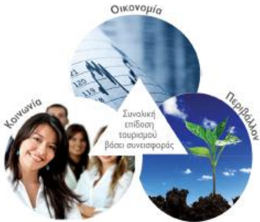
Εικόνα 3. Το νέο αναπτυξιακό μοντέλο - Triple Bottom Line