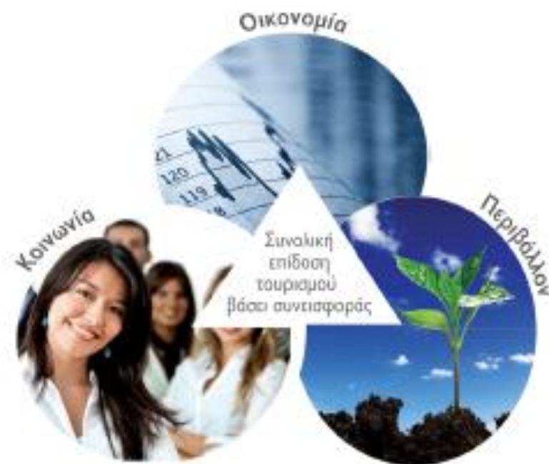
Εικόνα 3. Το νέο αναπτυξιακό μοντέλο - Triple Bottom Line 57

Οι προσπάθειες αυτές γίνονται εδώ και χρόνια μέσα από χρόνο σχέδιο δράσης που αναπτύσσεται αναπτυξιακά και διευρυμένα. Πρόκειται για πρόγραμμα που σχεδιάστηκε ολοκληρωτικά και με προσοχή και στοχεύει να αξιοποιήσει τα συγκριτικά πλεονεκτήματα της Αθήνας και να καλύψει το στοίχημα για γρήγορη και επιτυχημένη ανάπτυξη.