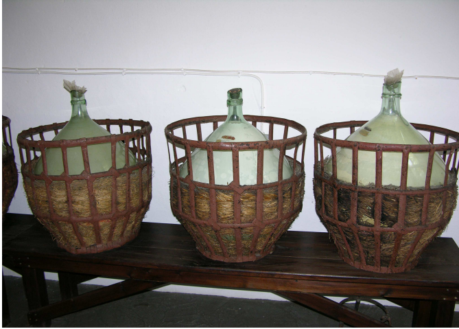
ΕΙΚΟΝΑ 4: Τζάρες

διαμορφωμένα δοχεία, τις λεγόμενες τζάρες, όπου και αφήνονται για ένα χρονικό διάστημα κι έπειτα μεταφέρεται στις εγκαταστάσεις εμφιάλωσης. Ανάλογα με την ποιότητα του αποστάγματος που επιζητείται, μπορεί να γίνει δεύτερη και τρίτη απόσταξη, δηλαδή βράσιμο του πρώτου αποστάγματος με νέα φύλλα. Έτσι το άρωμα και η γεύση του κίτρου γίνονται πιο έντονες.