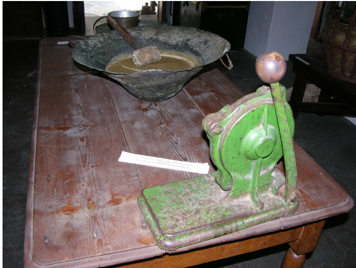
ΕΙΚΟΝΑ 6: Μηχανισμός σφράγισης φιάλης