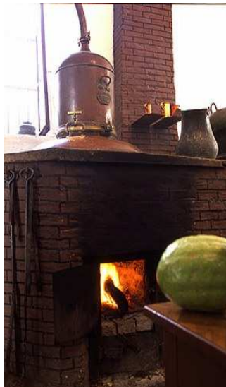
ΕΙΚΟΝΑ 3: Αποστακτήρας

Σε όσο το δυνατό σύντομο χρονικό διάστημα από τη συγκομιδή, τα φύλλα μπαίνουν στον αποστακτήρα. Η απόσταξη γίνεται με καθαρό οινόπνευμα και νερό. Για καύσιμο υλικό χρησιμοποιείται μόνο ξύλο ελιάς κι αυτό γιατί η καύση του είναι πιο αργή. Βράζουν για περίπου 10 ώρες και καθώς βράζουν, το οινόπνευμα παίρνει τα αιθέρια έλαια των φύλλων (στην ουσία αρωματίζεται το αλκοόλ από τα φύλλα) και ο ατμός, που γίνεται στους 75 °C, μεταφέρει τα αιθέρια έλαια, περνάει μέσω ενός σωλήνα στο ψυγείο (πρόκειται για έναν μεγάλο κύλινδρο που έχει γύρω-γύρω παγωμένο νερό) όπου ψύχεται και υγροποιείται (με τον ίδιο τρόπο γίνεται και η ρακή). Η φωτιά διατηρείται χαμηλή και μόλις πλησιάσει η εξάτμιση και υγροποίηση των ατμών στον ψυκτήρα νερού, η ένταση μειώνεται ακόμα περισσότερο. Το απόσταγμα φυλάσσεται σε βαρέλια, ενώ παλαιότερα σε ειδικά