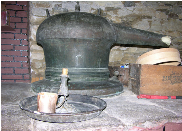
ΕΙΚΟΝΑ 2: Καζάνι κιτρόρακου

Τα φύλλα της κιτριάς σε υπεραφθονία παλαιότερα, χρησιμοποιούνταν για να δώσουν το λεπτό και ιδιαίζον άρωμά τους, στην ρακή των αμπελοκαλλιεργητών (αλλού χρησιμοποιείται ο γλυκάνισος, ο μάραθος, τα ξερά σύκα κ.α. ). Γι' αυτό και το πρώτο όνομα ήταν κιτρόρακο. Το "Κίτρο Νάξου" είναι ένα ηδύποτο (λικέρ), απόσταγμα 100% των φύλλων της κιτριάς.