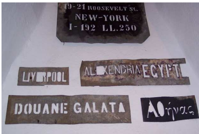
ΕΙΚΟΝΑ 1: Σφραγίδες