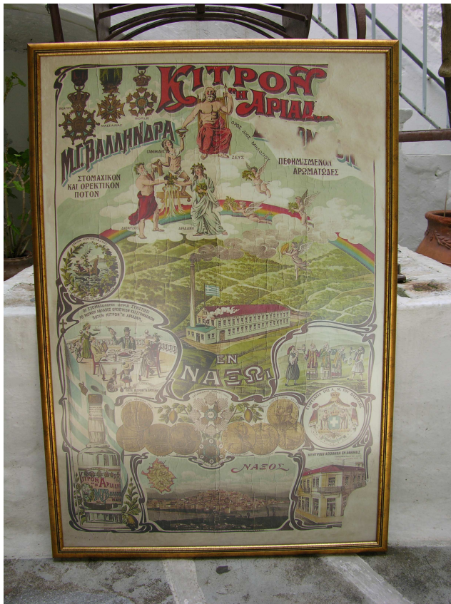
ΕΙΚΟΝΑ 8: Διαφημιστική αφίσα, αρχές του 20 ου αιώνα

Το ΚΙΤΡΟ ΝΑΞΟΥ έχει κατοχυρωθεί σαν Ελληνικό τοπικό παραδοσιακό προϊόν με «Όνομασία προέλευσης» και έχουν προχωρήσει οι διαδικασίες για τον χαρακτηρισμό του και με βάση τα Ευρωπαϊκά πρότυπα. Το χαρακτηρισμό αυτό έχουν δύο μόνο ακόμη ελληνικά προϊόντα, το κουμ – κουάτ της Κέρκυρας και η μαστίχα Χίου.