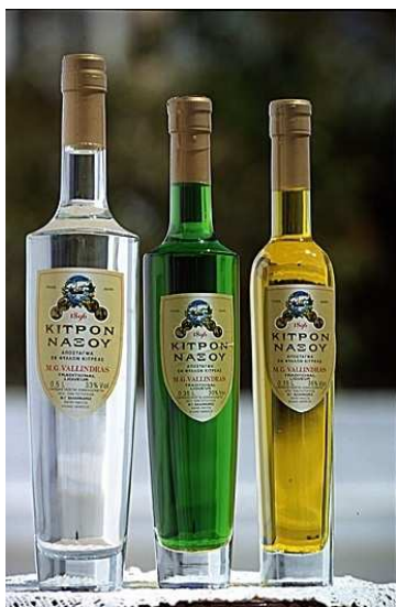
ΕΙΚΟΝΑ 5:Είδη λικέρ Κίτρου

Το πράσινο κίτρο , παραδοσιακά ποτό λικέρ, περιέχει οινόπνευμα 30 %, περισσότερη ζάχαρη και πράσινη φυσική χρωστική, όπου προέρχεται από την χλωροφύλλη των φύλλων, η οποία παραλαμβάνεται από την Αθήνα συσκευασμένη σε μορφή πούδρας,