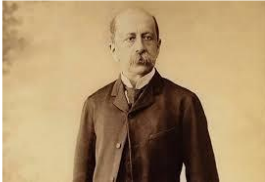
Χαρίλαος Τρικούπης Πρωθυπουργός της Ελλάδας 1893

Μετά τις εκλογές του 1886 όπου το κόμμα του Τρικούπη θριάμβευσε, προχώρησε στην εσωτερική και οικονομική αναδιοργάνωση της χώρας, όπου έθεσε και τα θεμέλια της οικονομικής νομοθεσίας του κράτους.