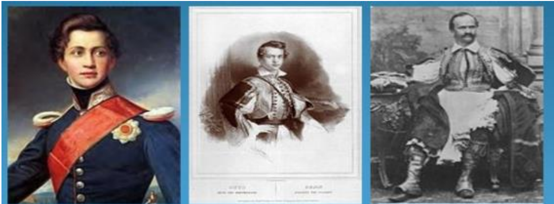
Όθων, πρώτος βασιλιάς της Ελλάδας(1832- 1862)

προκειμένου να επιτύχουν όσο το δυνατόν γρηγορότερα τους στόχους τους δηλαδή μέσα από την εκλογή του βασιλιά θα μπορούσαν με τον τρόπο αυτό να ελέγχουν την πολιτική και την οικονομική κατάσταση της χώρας. Έτσι δίχως να χάσουν ώρα πρότειναν τον γιο του Ναπολέοντα αλλά και πάλι δεν εκλέχτηκε λόγω του Γάλλου βασιλιά. Τότε τελικά προχώρησαν στην επιλογή του Όθωνα με τον οποίο ήταν σύμφωνες και οι μεγάλες δυνάμεις.