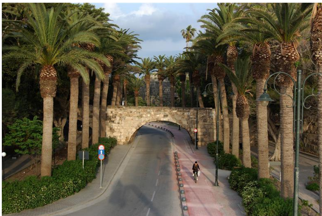
Εικόνα: Γέφυρα των φοινίκων

Η λεωφόρος των φοινίκων. Πρόκειται για ένα από τα διασημότερα ορόσημα του νησιού της Κω, καθώς δίνει πρόσβαση και στο κάστρο των ιπποτών του Αγίου Ιωάννη.