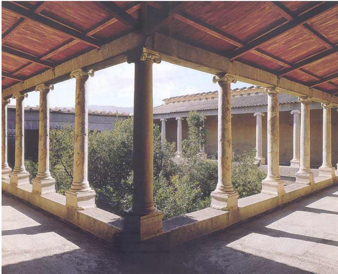
Εικόνα: Ρωμαϊκή οικία ή Casa Romana