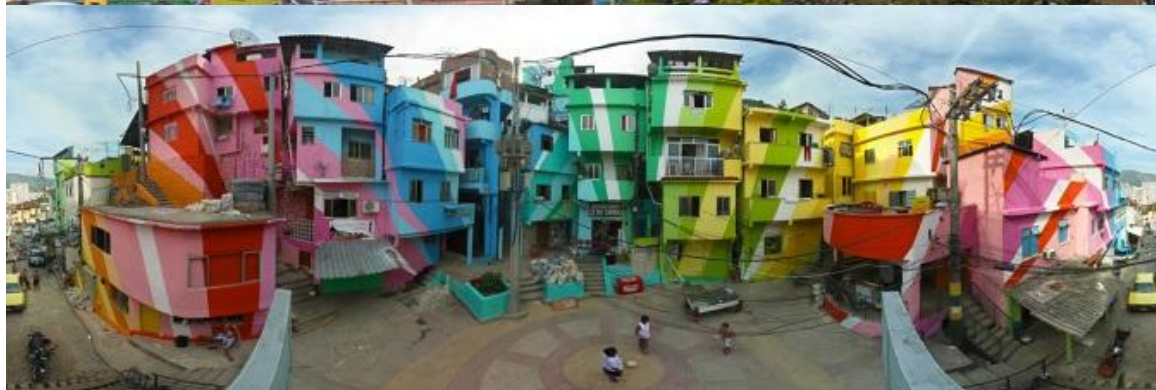
Favela Painting Project-Rio de Janeiro 8

Παρά τα διαφορετικά μοντέλα Αστικής Αναβίωσης, μία αναζωογονημένη περιοχή μπορεί να επιφέρει θετικές επιπτώσεις σε οικονομικό, κοινωνικό και περιβαλλοντικό επίπεδο. Ειδικότερα, σε οικονομικό επίπεδο αποτελεί πόλο έλξης επενδύσεων, τουρισμού, που συνεπάγονται νέες θέσεις εργασίας για τον τοπικό πληθυσμό (το Birmingham καταπολέμησε τα υψηλά επίπεδα ανεργίας επενδύοντας στη δημιουργία πολιτιστικών μονάδων, που αποτελούν καίριο παράγοντα