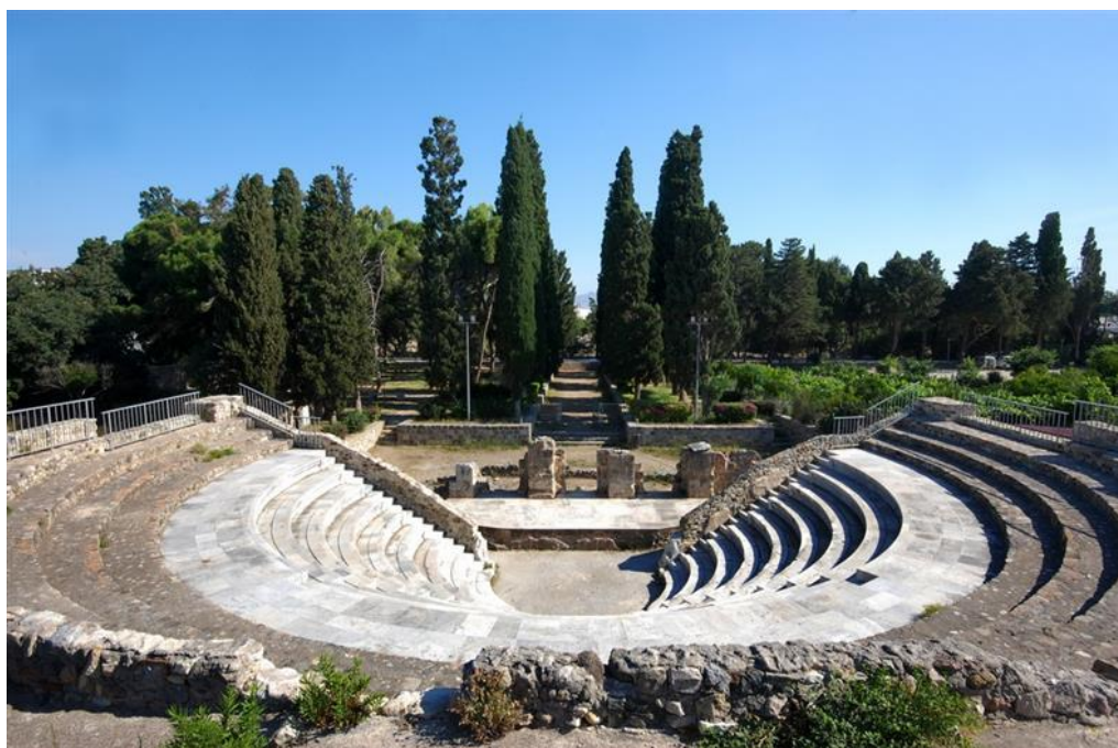
Εικόνα:Ρωμαϊκό Ωδείο Κω 30