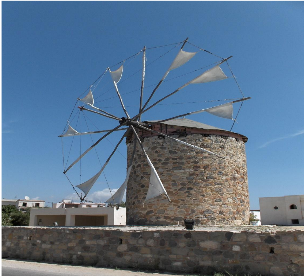
Εικόνα: Ανεμόμυλος Αντιμάχειας

Η Κως χαρακτηρίζεται για τις παραλίες με μεγάλη ακτογραμμή, αμμώδεις ακτές εκ των οποίων οι βόρειες είναι περισσότερο εκτεθειμένες σε ανέμους. Η πλειοψηφία των ακτών έχει αξιοποιηθεί τουριστικά με εύκολη πρόσβαση. Άλλο ένα μοναδικό χαρακτηριστικό είναι τα Θερμά ή αλλιώς Εμπρός Θέρμες. Βρίσκονται στο νοτιοανατολικό τμήμα του νησιού περίπου 13 χιλιόμετρα από την πόλη της Κω. Πρόκειται για ιαματικές πηγές που θεωρούνται κατάλληλες για την ίαση δερματικών, αρθρικών και ρευματικών παθήσεων. Η θερμοκρασία των νερών κυμαίνεται από 30 μέχρι 50 βαθμούς κελσίου. Πρόκειται για ένα φυσικό σπα, στο μπροστινό μέρος της παραλίας έχει δημιουργηθεί μια μικρή λίμνη που διαχωρίζεται από την υπόλοιπη παραλία με βράχια που επιτρέπουν στο θαλασσίνο νερό να εισέρχεται και να δροσίζει τα καυτά νερά.