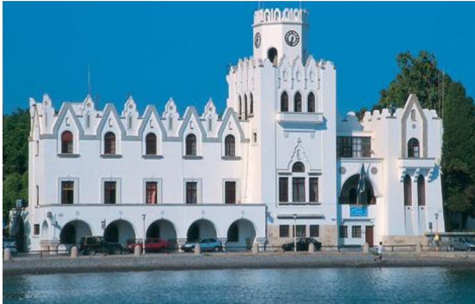
Εικόνα: Διοικητήριο, Palazzo Del Governo. 29