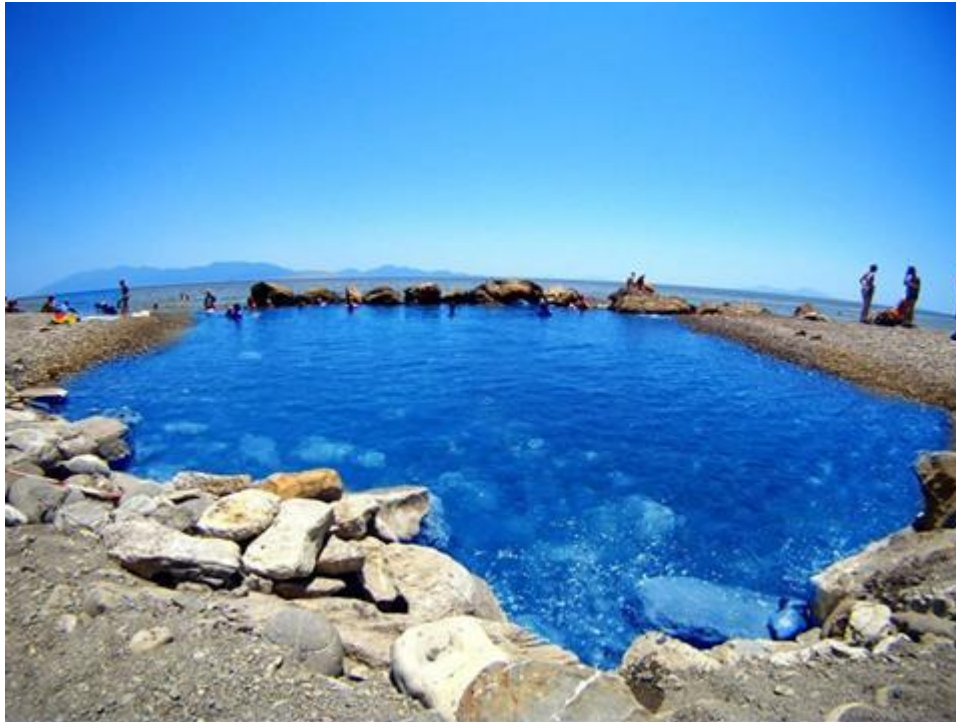
Εικόνα: Θερμά ή Εμπρός Θέρμες

Αξίζει να σημειωθεί ότι διάφοροι φορείς του νησιού αγωνίστηκαν για να συμπεριλάβουν τον «Πατέρα της Ιατρικής» - τον Ιπποκράτη της Κω- στον κατάλογο της Παγκόσμιας Κληρονομιάς της UNESCO. Το σπουδαίο μνημείο του 4 ου αιώνα π.Χ. όπως το Ασκληπιείο, με καλά διατηρημένα τα διαζώματα, τα άνδρα και τα απομεινάρια των αρχιτεκτονικών δομών του, θα έπρεπε εδώ και χρόνια να βρίσκεται υπό την αιγίδα της διεθνούς οργάνωσης πολιτιστικών και Αρχαιολογικών χώρων της UNESCO, ως μνημείο παγκόσμιας πολιτιστικής κληρονομιάς.