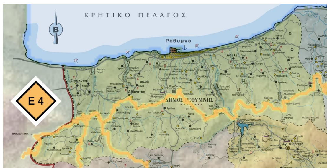
Το μονοπάτι Ε4 στα Ανώγεια

Το χωριό Μαργαρίτες διατηρεί ακόμα την παλιά Κρητική φιλοξενία, οπότε ετοιμαστείτε να σας μεταχειριστούν εξαιρετικές κρητικές λιχουδιές σε συνδυασμό με μια βολή της διάσημης κρητικής ρακής: ο καλύτερος τρόπος για να ολοκληρώσετε αυτή την υπέροχη πεζοπορική διαδρομή του μονοπατιού Ε4 Ρεθύμνου.