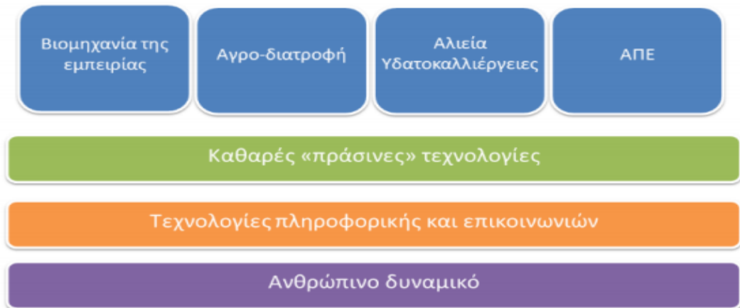
Πίνακας 4.5. Το Όραμα της Στρατηγικής Έξυπνης Εξειδίκευσης της Περιφέρειας Νοτίου Αιγαίου