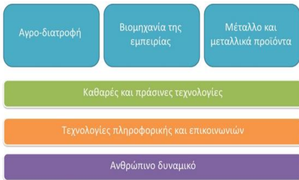
Πίνακας 4.6. Το Όραμα της Στρατηγικής Έξυπνης Εξειδίκευσης της Περιφέρειας Στερεάς Ελλάδας