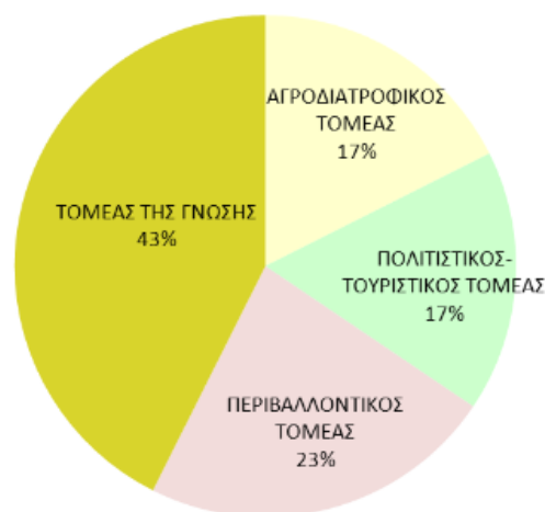
Διάγραμμα 5.2 "Κατανομή του προϋπολογισμού ανά Τομέα –Σύμπλεγμα προτεραιότητας"