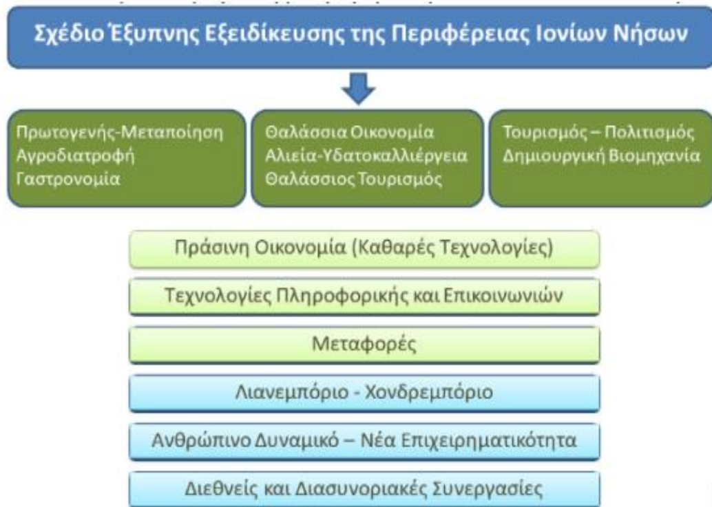
Πίνακας 4.4. Το Όραμα της Στρατηγικής Έξυπνης Εξειδίκευσης της Περιφέρειας Ιονίων Νήσων