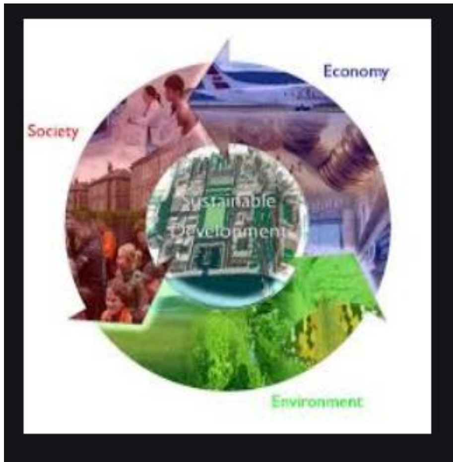
Εικόνα 1.1. Η Βιώσιμη Ανάπτυξη και οι Τρεις Κύριες Συνιστώσες της

όλο το διαθέσιμο εργατικό της δυναμικό, προκειμένου να μπορέσει να ανταποκριθεί πλήρως στις ανάγκες και τις απαιτήσεις του ανταγωνιστικού αυτού περιβάλλοντος 14 .