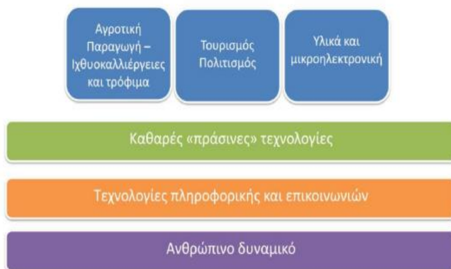
Πίνακας 4.3. Το Όραμα της Στρατηγικής Έξυπνης Εξειδίκευσης της Περιφέρειας Δυτικής Ελλάδας