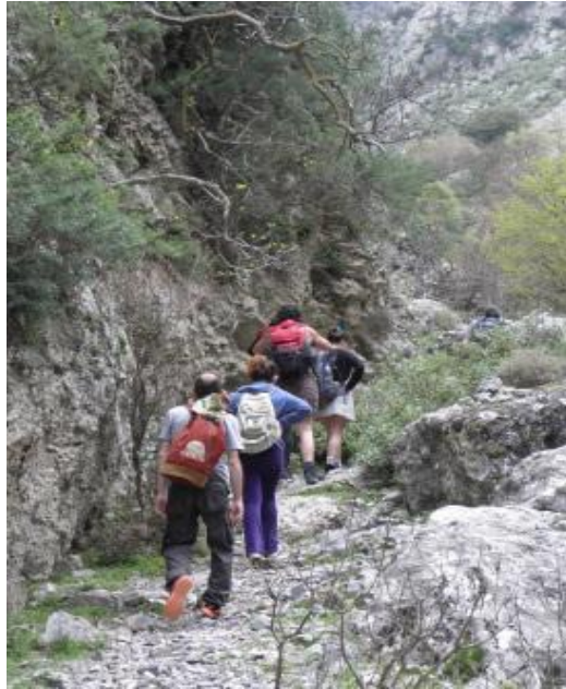
ΕΙΚΟΝΑ 6.2 ΟΡΕΙΒΑΣΙΑ ΣΤΑ ΒΟΥΝΑ ΤΗΣ ΚΡΗΤΗΣ