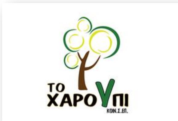
ΕΙΚΟΝΑ 6.1 ΤΟ ΧΑΡΟΥΠΙ

Η επιχείρηση «Το Χαρούπι», έλαβε την άδειά της το 2015 από το Μητρώο Κοινωνικής Οικονομίας του Υπουργείου Εργασίας. Έτσι, εγκρίθηκε το καταστατικό που την κατέστησε «Κοινωνική Συνεταιριστική Επιχείρηση Συλλογικού και Παραγωγικού Σκοπού» με την επωνυμία «Χαρούπι Κοιν.Σ.Επ.», με έδρα το Χουδέτσι Ηρακλείου Κρήτης.