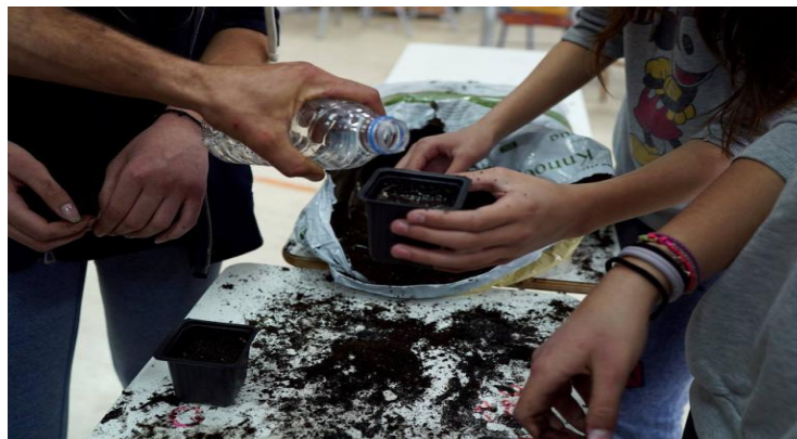
ΕΙΚΟΝΑ 6.3 ΒΙΩΜΑΤΙΚΕΣ ΔΡΑΣΤΗΡΙΟΤΗΤΕΣ ΟΙΚΟΛΟΓΙΑΣ

Ο οικολογικός τουρισμός αναπτύσσεται μέσα σε τομείς μη βλαβερούς για το περιβάλλον. Μέσα στο πλαίσιο αυτό μπορεί να περιλαμβάνεται ο τόπος διαμονής των επισκεπτών μέχρι και τις δραστηριότητες που θα επιλέξουν, ή και το αναμνηστικό στο τέλος του ταξιδιού/εκδρομής. Σκοπός, λοιπόν, είναι οι επισκέπτες να έχουν την ευκαιρία να γνωρίσουν κάποιες διαφορετικές πτυχές ενός τόπου, μέσω μίας οικολογικής και αλληλέγγυας πρακτικής.