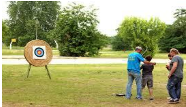
ΕΙΚΟΝΑ 6.6 ΤΟΞΟΒΟΛΙΑ ΣΤΗΝ "ΑΓΚΙΣΤΡΟ ΔΡΑΣΗ"

Ακόμη, η «Άγκιστρο Δράση» διοργανώνει εκδρομές χαλαρωτικού- θεραπευτικού χαρακτήρα στα γνωστά Βυζαντινά Λουτρά, που θεωρούνται από τα παλαιότερα στην Ελλάδα. Το γραφείο προσφέρει πολλές συνδυαστικές εκδρομές, όπου ο επισκέπτης μπορεί να συνδυάσει τη χαλάρωση με τη δημιουργική ένταση. Πέραν των δραστηριοτήτων που προσφέρει η «Άγκιστρο Δράση», μέσω της συνεργασίας της με ξενοδοχεία και ξενώνες του Αγκίστρου οι επισκέπτες μπορούν να βρουν δωμάτια σε καλύτερες τιμές. Τέλος, η επιχείρηση ασχολείται με την καλλιέργεια, την τυποποίηση και την διάθεση προϊόντων με βάση το θεραπευτικό φυτό κρανιά. (social-economy.com)