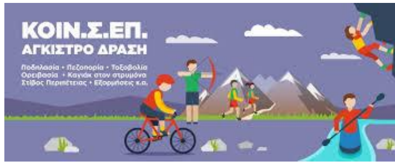
ΕΙΚΟΝΑ 6.5 ΔΡΑΣΤΗΡΙΟΤΗΤΕΣ ΤΗΣ «ΑΓΚΙΣΤΡΟ ΔΡΑΣΗ»