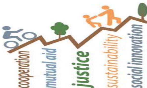
ΕΙΚΟΝΑ 2.2 ΚΟΙΝΩΝΙΚΗ ΚΑΙΝΟΤΟΜΙΑ

Την σήμερον ημέρα, κάποιες κοινωνικές καινοτομίες έχουν γνωρίσει τεράστια επιτυχία και έχουν αποτελέσει ένα πολύ σημαντικό και αναπόσπαστο κομμάτι της κοινωνίας μας, σε σημείο που να μην αντιλαμβανόμαστε την αρχική πηγή της καινοτομίας τους. Ωστόσο, με την πάροδο του χρόνου οι ανθρώπινες ανάγκες τείνουν να αλλάζουν, έτσι ορισμένες κοινωνικές καινοτομίες θα υποκατασταθούν από νέες κοινωνικές καινοτομίες που θα καλύπτουν νέες ανθρώπινες ανάγκες. Τέλος, δεν θα πρέπει να ξεχνάμε πως η κοινωνική καινοτομία είναι ένα σημαντικό μέσο χάραξης πολιτικών, κοινωνικής και τοπικής ανάπτυξης, δεν αποτελεί όμως από μόνο του σκοπό. (JobTown URBACT, 2014)