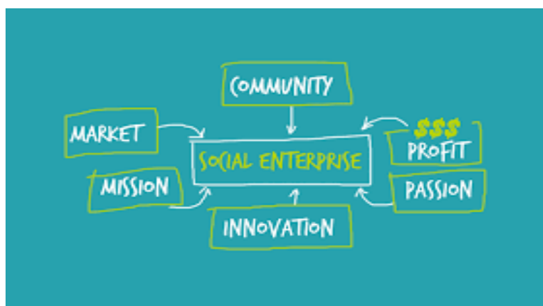
ΕΙΚΟΝΑ 3.1 ΚΟΙΝΩΝΙΚΗ ΕΠΙΧΕΙΡΗΜΑΤΙΚΟΤΗΤΑ

Οι κοινωνικές επιχειρήσεις είναι επιχειρήσεις που εστιάζουν στον συλλογικό χαρακτήρα και δεν έχουν κάποιο κερδοσκοπικό ενδιαφέρον, στοχεύουν στην κοινωνία σε συνδυασμό με την οικονομία, επιδιώκουν να καταπολεμήσουν την ανεργία, τον κοινωνικό αποκλεισμό, ακόμη επιδιώκουν την κάλυψη ζητημάτων και αναγκών κοινωνικού ενδιαφέροντος, όπως περιβαλλοντικά ζητήματα και ζητήματα πρόνοιας και αλληλεγγύης. (Χρυσάκης, Ζιώμας, Χατζαντώνης, & Καραμητροπούλου, 2002)