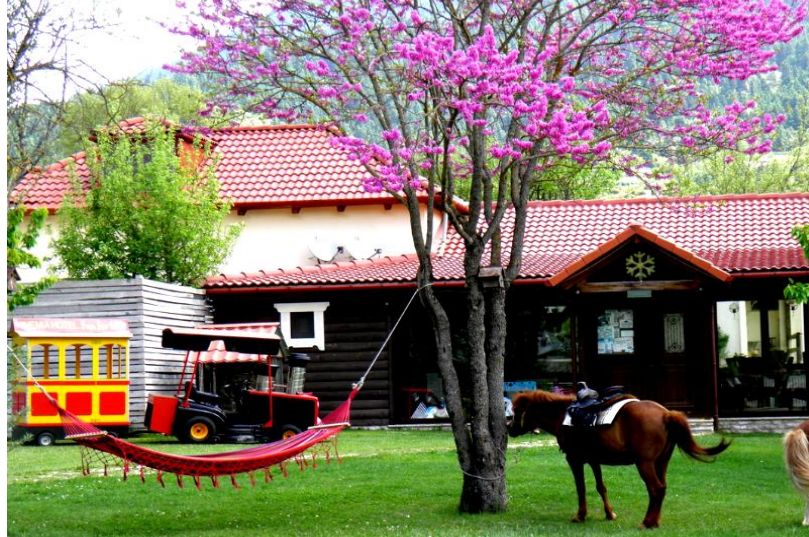
ΕΙΚΟΝΑ 1.1 ΑΓΡΟΤΟΥΡΙΣΜΟΣ