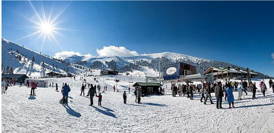
ΕΙΚΟΝΑ 1.2 ΧΙΟΝΟΔΡΟΜΙΚΟΣ ΤΟΥΡΙΣΜΟΣ

ξενοδοχεία, ειδικά σχεδιασμένα για χειμερινά σπορ, κοντά ή σε απόσταση από ορεινούς οικισμούς. Αυτή η μορφή τουρισμού, αναφέρεται σε τουριστική δραστηριότητα που εξασκείται κατά τη διάρκεια της χειμερινής περιόδου λόγω των κλιματολογικών συνθηκών που απαιτούνται για τις συγκεκριμένες δραστηριότητες, όπως χιονοδρομία, ελκηθροδρομία κλπ.