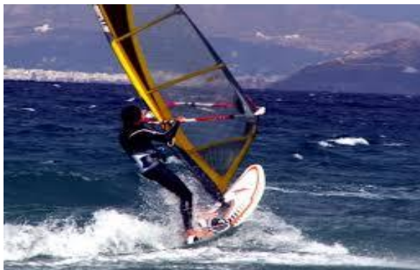
ΕΙΚΟΝΑ 1.4 ΘΑΛΑΣΣΙΟΣ ΤΟΥΡΙΣΜΟΣ

Ο θαλάσσιος τουρισμός αναφέρεται σε τουριστικές δραστηριότητες που λαμβάνουν μέρος στον θαλάσσιο χώρο μιας χώρας που υποδέχεται τους τουρίστες. Οι δραστηριότητες αυτές θα πρέπει να είναι αναπόσπαστο κομμάτι της συγκεκριμένης τουριστικής μορφής και όχι μόνο ένα μέσο για την πραγματοποίηση των διακοπών.