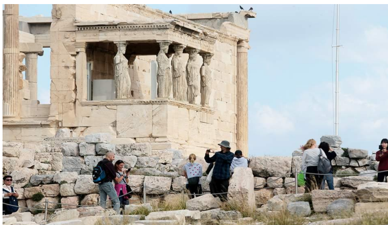
ΕΙΚΟΝΑ 1.3 ΠΟΛΙΤΙΣΜΙΚΟΣ ΤΟΥΡΙΣΜΟΣ

Ο πολιτισμικός τουρισμός αναφέρεται σε τουριστικά ταξίδια που έχουν ως κυρίαρχο κίνητρό τους, δραστηριότητες που σχετίζονται με τον πολιτισμό, όπως η επίσκεψη αρχαιολογικών χώρων, φεστιβάλ και θεατρικών παραστάσεων συνδυάζοντας την γνωριμία της τοπικής παράδοσης και ιστορίας, ηθών, εθίμων και τοπικής γαστρονομίας. Είναι μια μορφή τουρισμού που διαθέτει ευρύ περιεχόμενο και εμπεριέχει αρκετές δραστηριότητες άλλων ειδικών μορφών τουρισμού της ίδιας κατηγορίας. Ακόμη, στις βασικές υποκατηγορίες της συγκεκριμένης μορφής, εντάσσεται ο γαστρονομικός και οινολογικός τουρισμός, που τις τελευταίες δεκαετίες σημειώνει ραγδαία ζήτηση στην τουριστική αγορά. (Μοίρα, 2009) (Τσαρτάς Π. , 1996)