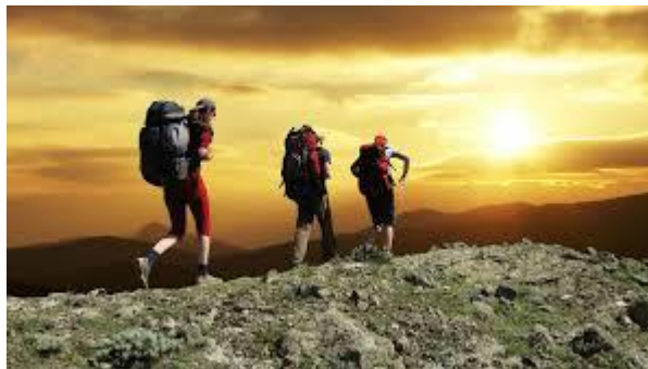
ΕΙΚΟΝΑ 1.5 ΑΘΛΗΤΙΚΟΣ ΤΟΥΡΙΣΜΟΣ

Ο αθλητικός τουρισμός αναφέρεται σε τουριστικές δραστηριότητες που σχετίζονται με κάποια αγωνίσματα μαζικού αθλητισμού, δηλαδή κατά την διάρκεια των διακοπών τους οι τουρίστες ασκούνται, τρέχουν, συναγωνίζονται κλπ.